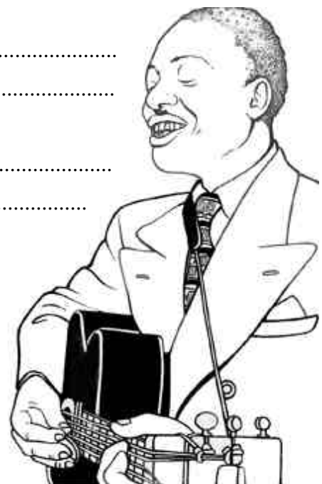
Big Billy Broonzy