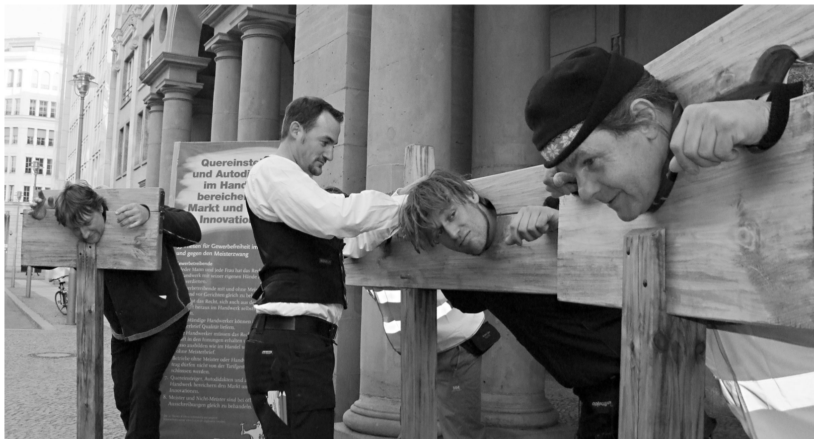
Freie Handwerker stehen heute wieder am Pranger, weil Handwerksmeister ihre Konkurrenz fürchten.

Der Berufsverband unabhängiger Handwerker und Handwerkerinnen – BUH e.V. tritt für die Gewerbefreiheit im Handwerk ein, berät Handwerker im Reisegewerbe und bietet Seminare für Existenzgründer im Handwerk mit und ohne Meisterbrief.