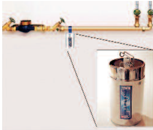
Zukunft – ja!