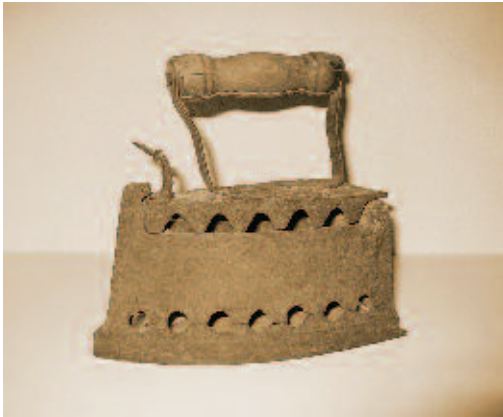
Nostalgie – nein!