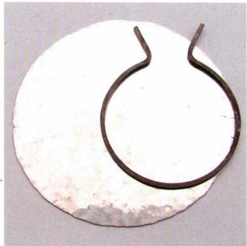
Abb. 5: Die gegossene Silberplatte nach dem Ausschmieden. Der dazugelegte Zwischenring veranschaulicht die Größenzunahme des Silberblechs. – The cast silver disc after hammering. The ring placed aside shows the growth of the silver sheet.