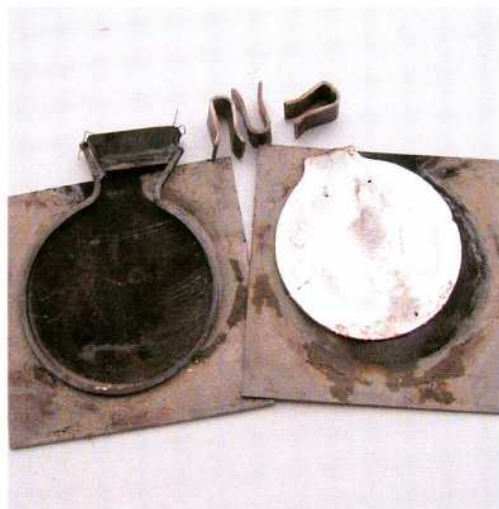
Abb. 3: Gussform für die Silberplatte, bestehend aus zwei Eisenplatten und Zwischenring. – Casting mould for the silver disc, consisting of two iron sheets and a ring between.

Enden nicht, sondern biege sie etwas auseinander, damit eine Öffnung entsteht, durch die du hineingießen kannst. Diesen Reifen passe gleichmäßig zwischen die beiden Eisenplatten so ein, daß seine Enden etwas außerhalb dieser Platten erscheinen. Klemme diese mit drei starken Eisenbügeln an drei Stellen zusammen, nämlich unten und beiderseits der Öffnung. Und dann schmiere durchgekneteten Ton rings um den Reifen zwischen die Eisenplatten und reichlich um dessen Öffnung. Diese Form wärme an, sobald sie getrocknet ist, und gieße das erschmolzene Silber hinein.