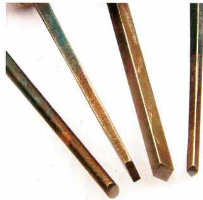
Abb. 13: Die unterschiedlichen Stichel- formen wie sie Theophilus beschreibt. – Theophilus gives the description of three shapes of burins.

Man macht auch ein rundes Werkzeug von der Dicke einer Gerte, dessen Spitze so angefeilt wird, daß die Furche, die es zieht, gerundet sei (BREPOHL 1987, 72) (Abb. 13).