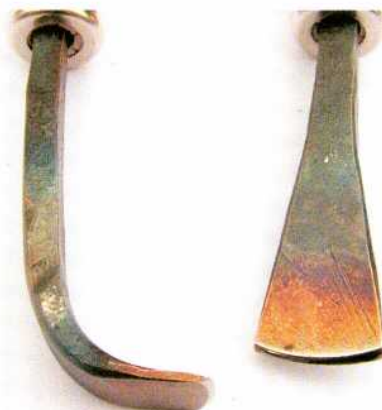
Abb. 10: Zwei Schaber, nach den Angaben von Theophilus angefertigt. – Two scrapers, made after the information of Theophilus.

Es werden auch schlanke Schaber angefertigt, die aber am Ende etwas breiter