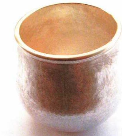
Abb. 9: Ein aufgelöteter Halbrunddraht akzentuiert und verstärkt den Becher- rand. – A soldered wire accentuates and reinforces the rim of the cup.

chen davon binde in ein Tuch und lege sie ins Feuer, damit sie so lange verbrennen, bis kein Rauch mehr aufsteigt.