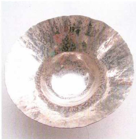
Abb. 7: Der Rand des Bechers während dem Aufziehvorgang. – The rim of the cup while the raising process.

Es gibt auch Hämmer, lang und verjüngt, die am Ende gerundet sind, (davon gibt es) größere und kleinere. Ferner gibt es Hämmer, die oben hornförmig, unten breit sind (BREPOHL 1987, 64).