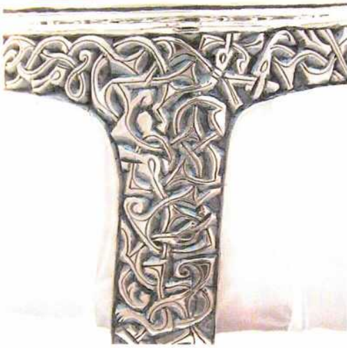
Abb. 17: Detail des gravierten Ornamentbandes auf der Nachbildung des Bechers. – Detail of the engraved ornamentation on the replication of the cup.

nehmen (BREPOHL 1987, 118) (Abb. 16-17).