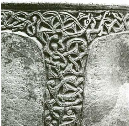
Abb. 2: Detail der gravierten Tierornamentik – Detail of the engraved animal-ornament.

cm. Verziert ist der Becher mit Streifen von Tierbandornamenten im „Tassilokelchstil“ (Abb. 2), seine Innenseite weist Reste von Vergoldung auf. Haseloff erwähnt Reste von Niello in den Vertiefungen der Ornamentstreifen (HASELOFF 1976/77, 135). Ich hege in diesem Punkt meine Zweifel, da so tiefe Gravuren einerseits für Niello unnötig und schwieriger zu