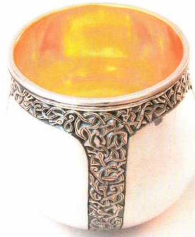
Abb. 16: Der Becher ist fertig, die vertieften Teile der Ornamentbänder sind geschwärzt. – The cup is finished, the lowered parts of the interlace decoration are blackend.

Farbe bekommen und den Glanz verlieren, den sie durch das Polieren angenommen hatten, kühle sie in Wasser ab und poliere sie wiederum sorgfältig durch Kratzen, bis sie einen hohen Glanz an-