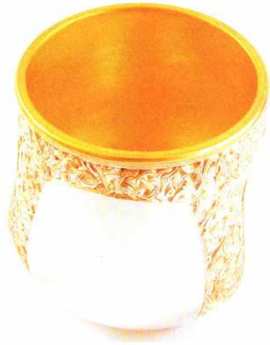
Abb. 15: Nach dem Feuervergolden ist die Goldschicht matt und muss noch poliert werden. – After fire-gilding the gold layer is matt and has to be polished.

Hast du sie mit den Spitzen „kratzend“ poliert, lege sie über die Kohlen, bis sie durch die Erwärmung eine rötlichgelbe