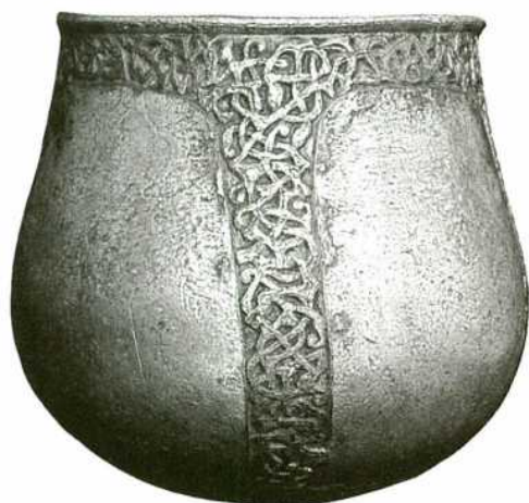
Abb. 1: Der Becher aus Pettstadt. – The chalice from Pettstadt.