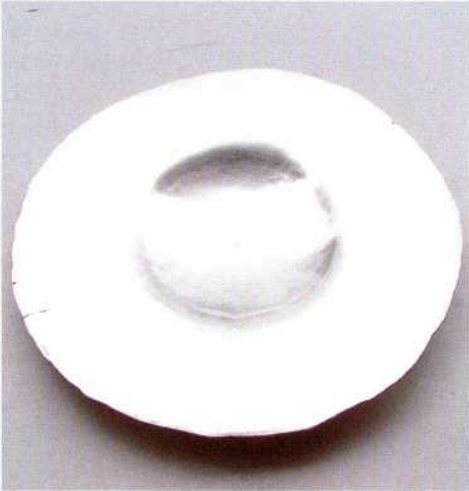
Abb. 6: In einem ersten Arbeitsschritt wird die Mitte des Silberblechs aufgetieft. – As a first working step, the center of the silver sheet is embossed.