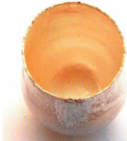
Abb. 8: Der Becher ist fertig aufgezogen und abgehämmert. – The cup is raised and planed.

26. Vom Anfertigen des kleineren Kelches Wenn du zu schmieden anfängst, suche