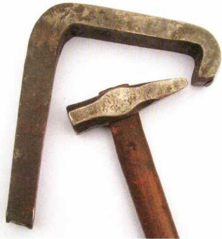
Abb. 4: Zungenamboss und Hammer, die zum Aufziehen des Bechers verwendet wurden. – Tongue-shaped anvil and hammer, used to raise the cup.

Es gibt auch Ambosse, die oben ähnlich einem halben Apfel gerundet sind, der eine größer, der andere kleiner, der dritte kurz, die „Nodi“ (Knoten) genannt werden. Ferner gibt es Ambosse, die oben langgestreckt sind und sich wie zwei aus einem Schaft herausragende Hörner verjüngen, das eine von ihnen soll rund und schlank sein, so daß es am Ende spitz ausläuft, das andere aber breiter und am Ende in gleichmäßiger Rundung ein wenig zurückgebogen, ähnlich einem Daumen; davon soll es größere und kleinere geben (BREPOHL 1987, 62) (Abb. 4).