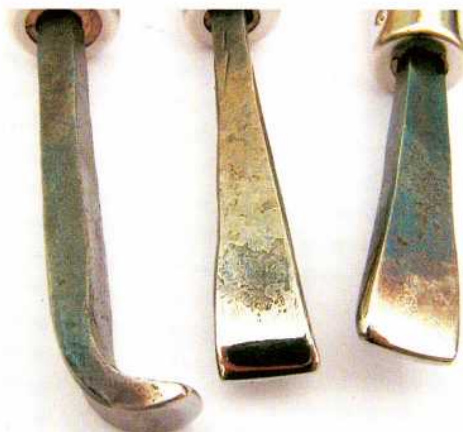
Abb. 11: Drei Polierstähle. – Three steel burnishers.

und auf einer Seite scharf sind, kleine und große, von denen einige entsprechend der Art des Werkstücks beliebig zurückgebogen sind (Abb. 10).