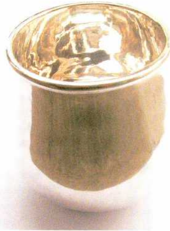
Abb. 12: Durch Schaben und Polieren erhält die Silberoberfläche ihren Glanz. – Scraping and burnishing gives shininess to the surface of the silver.

Nimm dann ein stumpfes Eisenwerkzeug und reibe es auf einem ebenen Schleif- stein, dann auf einem Eichenbrett, auf das du gemahlene Kohle gestreut hast. Mit diesem poliere das Kelchgefäß innen und außen und reibe dann mit einem Lap- pen und feingeschabter Kreide nach, bis das ganze Werk glänzt (BREPOHL 1987, 90-93) (Abb. 12).