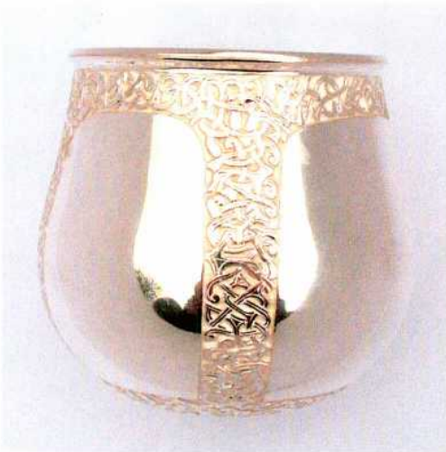
Abb. 14: Die Gravur wird so tief geschnitten wie die Wandstärke es erlaubt. – The engraving is cut as deep as the wall thickness allows.

Nimm Weinstein, von dem wir oben gesprochen haben, zerreibe ihn sorgfältig auf einem trockenen Stein, füge einen dritten Teil Salz zu und gib die Mischung in eine große tönernerne Schmelzschale, gieße das Wasser darüber, in das du vorhin das geriebene Vergoldungsamalgam geschüttet hattest, füge etwas Quecksilber zu, stelle auf die Kohlen, bis es warm wird, und rühre mit einem Holz um.