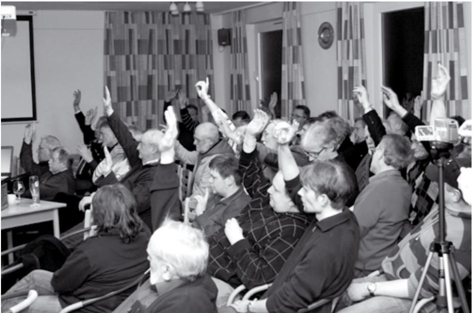
Die VfL-Mitglieder stimmten für den Verkauf des Germania-Geländes.

Klar ist aber auch, dass in der Vergangenheit in vielen Bereichen beim VfL zu hohe Kosten entstanden sind. Der neue Vorstand hat in seiner rund einjährigen Amtszeit viele dieser Kosten reduziert. „Soweit das möglich war, haben wir das getan. Uns war aber wichtig, dass der sportliche Bereich dadurch nicht eingeschränkt wird“, so Dinkela. Stattdessen wuchs der VfL zuletzt sogar. 50 neue Mitglieder kamen hinzu, so dass der Verein jetzt