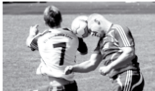
Die Leybuchter Fußballer stehen für vollen kämpferischen Einsatz. Im Hinspiel verlor Germania 0:1.

dem Wunschzettel größerer Vereine steht. Nach der Trennung von Trainer Erich Heyken im Herbst des vergangenen Jahres konnte Leybucht unter Trainer Klaus Rumfeld den Anschluss an die Nicht-Abstiegsplätze herstellen. Vor allem die Heimmiederlage gegen Konkurrent Middels (1:2) war zuletzt aber ein Rückschlag im Abstiegskampf.