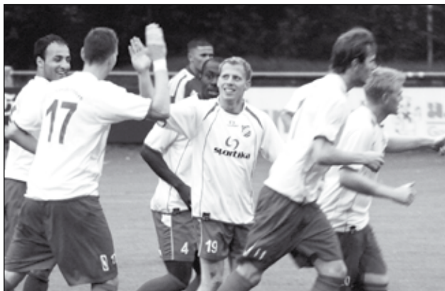
Die Ihrhover hatten in dieser Saison schon oft Grund zum Jubeln.