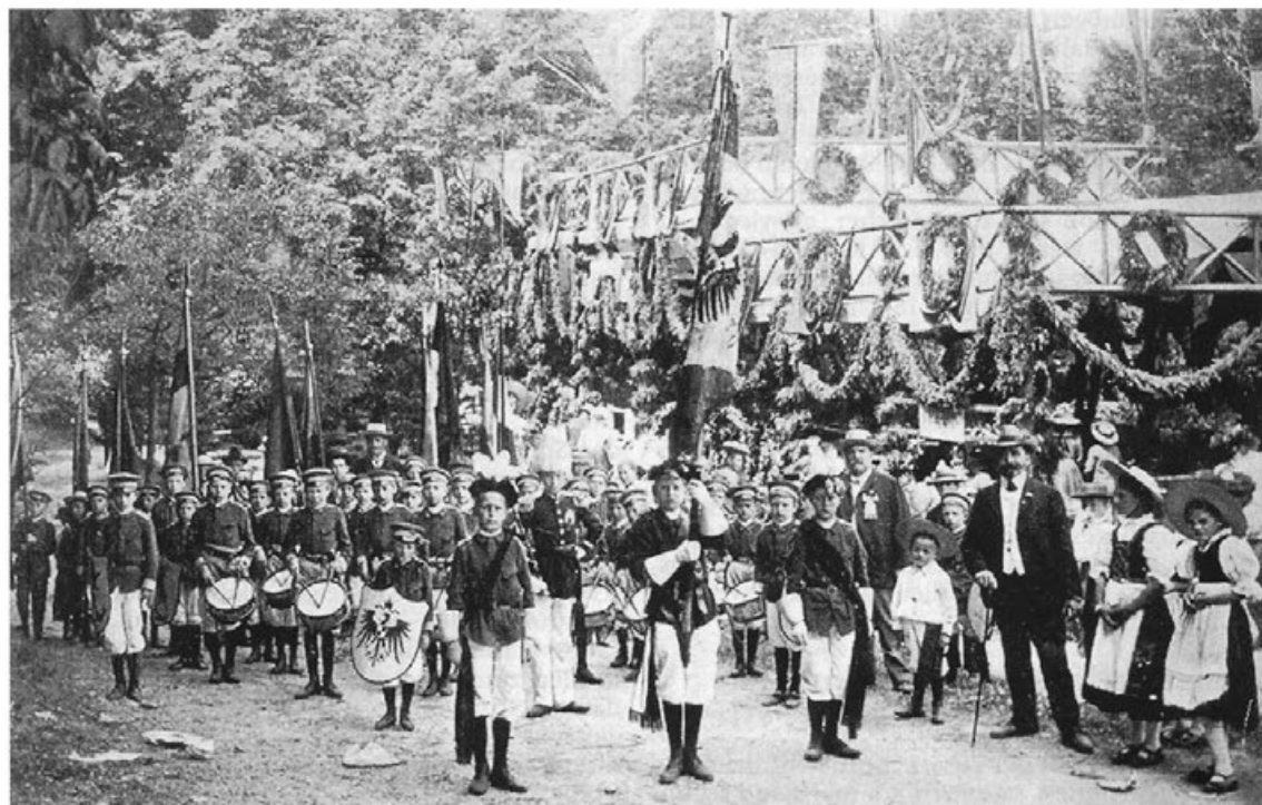
Im Jahre 1912 stand auf dem „Schützenberg“ ein ähnlicher, nun aber vergrößerter Aufbau.