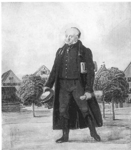
Johann Baptist Pflug: Schullehrer Bopp von Biberach. Städtische Sammlungen Biberach, Inv. 6108.

J. J. 1816 ließ Herr Stecher das erstmal am Schützendiensttag Nachmittag, die Preise, durch Abtheilungen von Knaben u. Mädchen, unter Voraustragung der Fahne, begleitet von 2. Tambours und einer Feld-Music, in der Stadt herum und auf den Schützenberg tragen, welches den Kindern