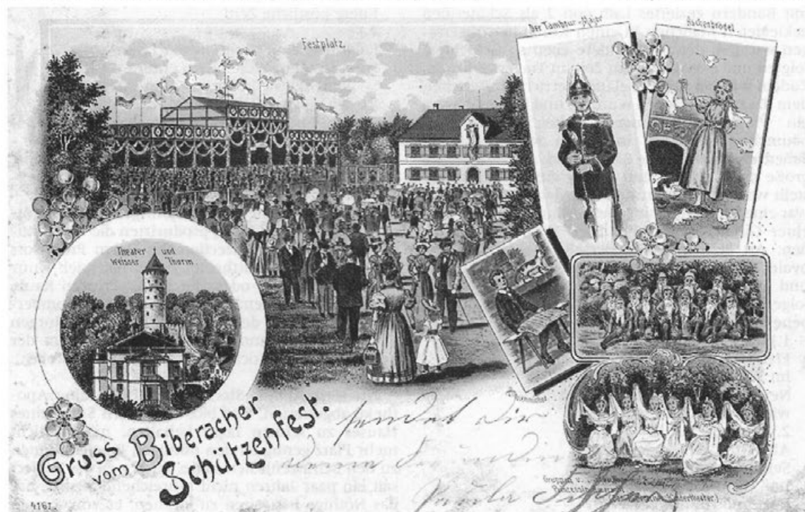
Vorlage: E. Müller, Biberach