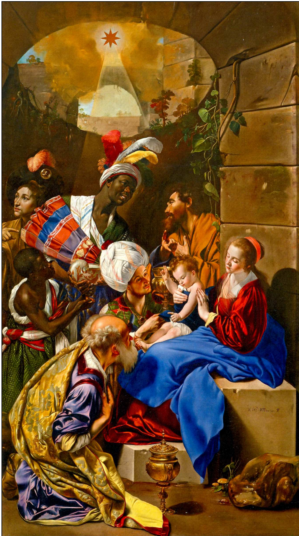
Anbetung der königlichen Weisen Autor: Juan Bautista Maíno, XVII. Jahrh. Museo Nacional del Prado. Madrid