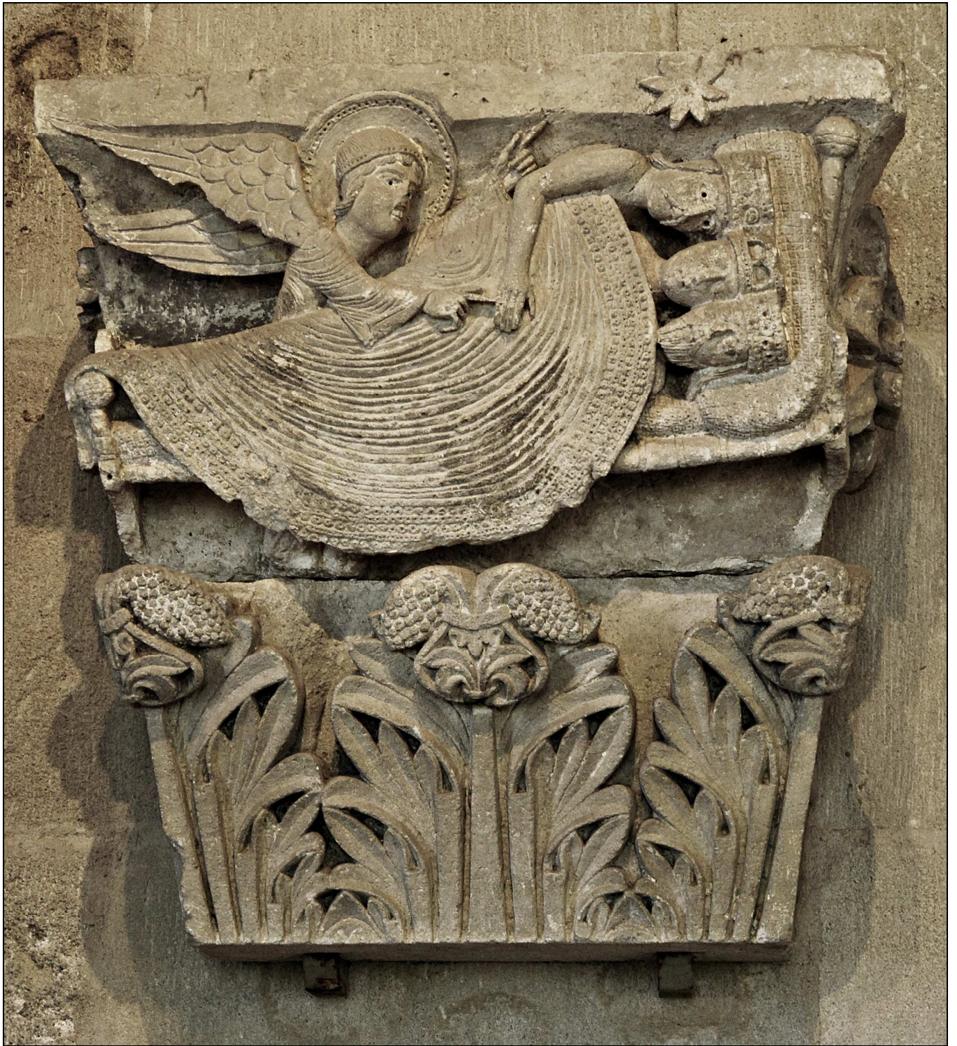
Der Traum der königlichen Weisen Französische Romanik, XII. Jahrh. Kathedrale San Lázaro, Autun