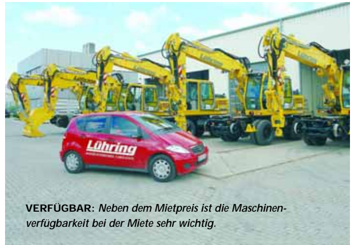
VERFÜGBAR: Neben dem Mietpreis ist die Maschinenverfügbarkeit bei der Miete sehr wichtig.

Baumaschinen-Hersteller wie Komatsu, Terex-Atlas, Ahlmann, Caterpillar, JCB oder Bomag bieten über die Händler- oder Vertriebsnetze Mietmaschinen an und überlassen die Mietkonditionen den jeweiligen Partnern selbst. Andere organisieren eine überregionale Vermietung zentral. Sowohl hier als auch bei herstellerunabhängigen Baumaschinenvermietern sind die Mietflotten oftmals jung und modern. Wenn sich herausstellt, dass sich der Kauf der Maschine aufgrund der hohen Einsatzrate und Funk-