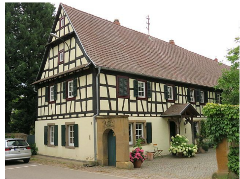
Abbildung 3: Anwesen Kohlhof 8: Bis zum Bau der Kirche war hier der Andachtsraum

Viele Jahre lang war eine private Stube im Wohngebäude Kohlhof 8 der Treffpunkt für die sonntäglichen Andachten. 1790 wurden offiziell religiöse Zusammenkünfte genehmigt, ebenso wie der Bau einer Kirche. Diese wurde jedoch erst 1888 fertiggestellt.