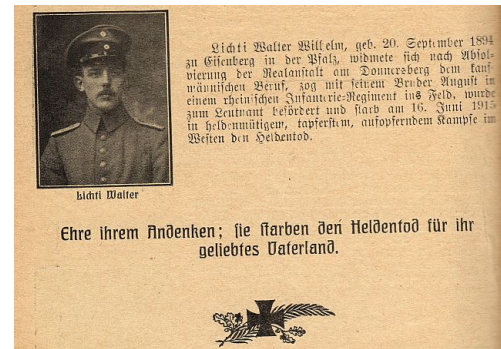
Abbildung 6: Aus dem "Christlichen Gemeindekalender 1917", herausgegeben von der "Konferenz der süddeutschen Mennoniten"

Nationalismus und die damit gelegentlich verbundene Kriegsbegeisterung ging auch an den Kohlhöfer Mennoniten nicht spurlos vorbei. 1871, nach dem gewonnenen Krieg gegen Frankreich und dem Inkraftsetzen einer Reichsverfassung, die auch den Mennoniten Bürgerrechte gab, wurde beim Anwesen Kohlhof 8 eine „Friedenslinde“ gepflanzt, die wohl eher eine „Siegesslinde“ war. Nationalstolz und Vaterlandsliebe der deutschen Mennoniten lassen sich gut am „Christlichen Gemeindekalender“ von 1917 darstellen, in dem der Toten des I. Weltkrieges gedacht wird. Auch für den Nationalsozialismus gab es bei den Kohlhöfer Mennoniten Sympathien. Die Gegner Hitlers schwiegen notgedrungen. Eine Rückbesinnung auf die täuferischen Traditionen erfolgte wieder nach dem II. Weltkrieg.