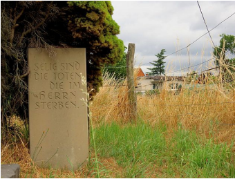
Abbildung 2: Begräbnisplatz auf dem "Grasplätzchen"

Gulden, später von 12 Gulden je Familie zahlen. Als den Mennoniten seit 1726 auch der Grunderwerb möglich wurde, sollten „die Christen Vorzug vor den Wiedertäufern haben“.