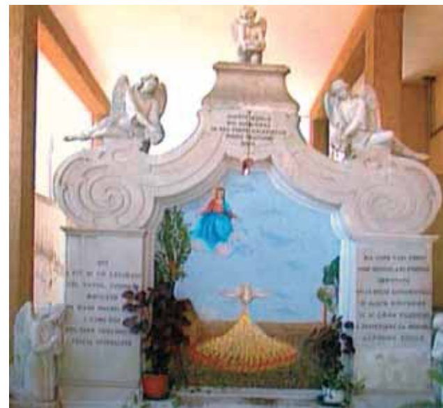
Gedenktafel am Ort der Wiederauffindung der Hostien