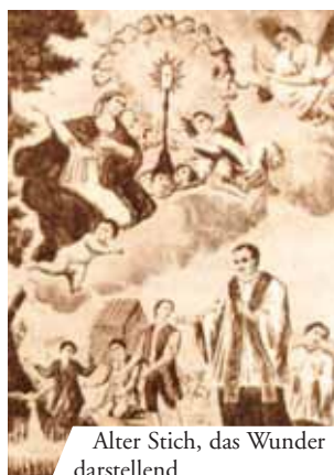
Alter Stich, das Wunder darstellend