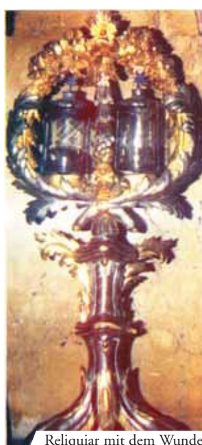
Reliquiar mit dem Wunder