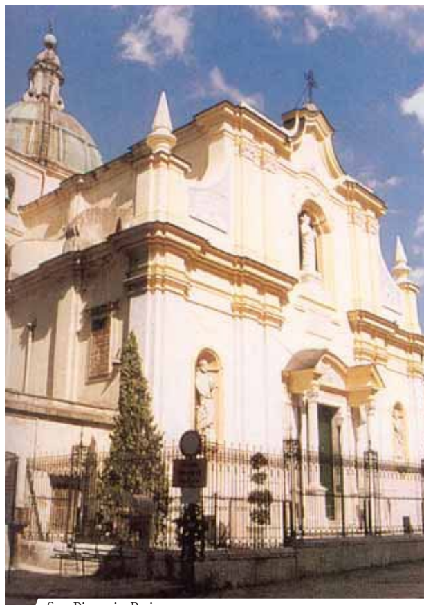
San Pietro in Patierno

Am 29. August 1774 äußerte sich die erzbischöfliche Kurie befürwortend bezüglich dieses Wunders, der unerklärbaren Wiederauffindung und Erhaltung gestohlener Hostien. Diese waren aus der Kirche San Pietro in Patierno am 24.2.1772 entwendet worden. 1971 wurde das Diözesane Eucharistische Jahr ausgerufen, um der diözesanen Gemeinde Gelegenheit zu geben, von dem eucharistischen Wunder Kenntnis zu nehmen. Leider wurden 1978 die Hostien mit ihrem wertvollen Reliquiar nochmals gestohlen und sind seitdem verschollen.