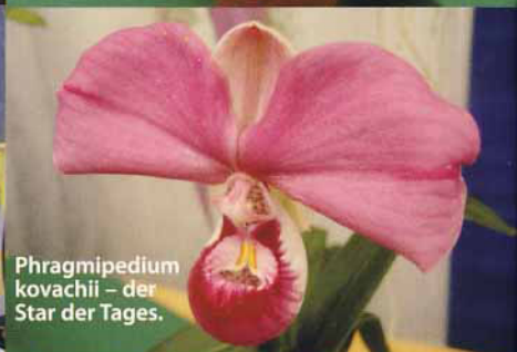
Phragmipedium kovachii – der Star der Tages.