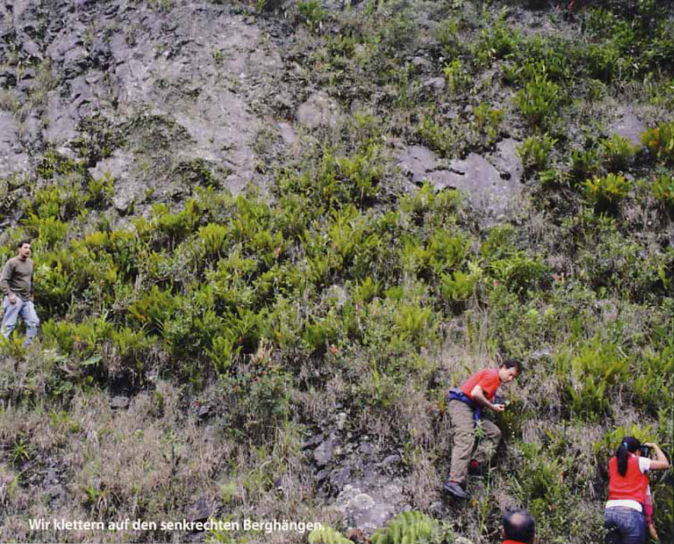
Wir klettern auf den senkrechten Berghängen.

trockenen Gras. Im Gemisch zwischen niedrigen Büschen und dünnen, verblühten Gräsern hatte sich eine Menge andere Orchideen ausgebreitet. Ein Teil der Pflanzen verschwand fast im Gebüsch. Da wurde einem klar, dass Ecuador eines der an Orchideen reichste Länder der Welt ist. Auf einigen wenigen Quadratkilometern wächst eine Unmenge verschiedener Arten. Am häufigsten kommt die Gattung Epidendrum vor.