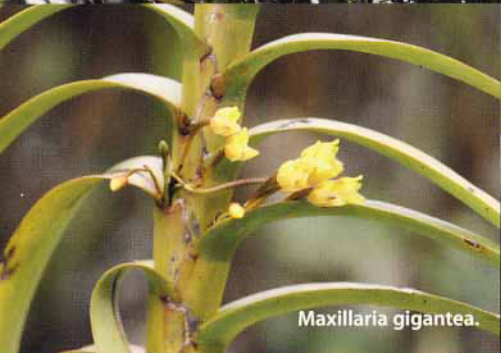
Maxillaria gigantea .