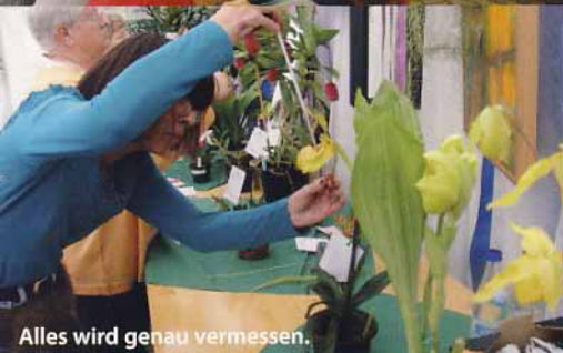
Alles wird genau vermessen.