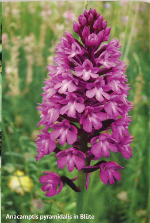
Anacamptis pyramidalis in Blüte

Mergelweg ersetzt. Gegenwärtig sind die Parzellen über die Cras d'Hermet-Straße und die Betonpiste von Bas d'Hermet zugänglich.