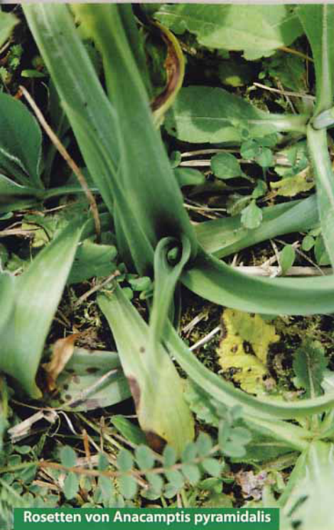
Rosetten von Anacamptis pyramidalis