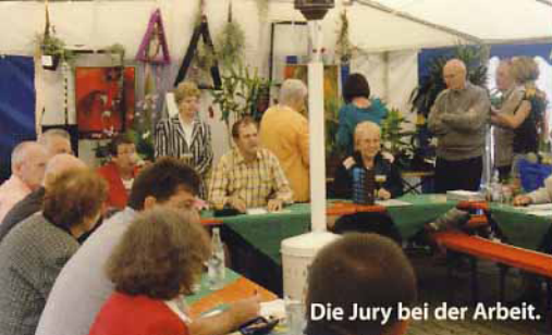
Die Jury bei der Arbeit.