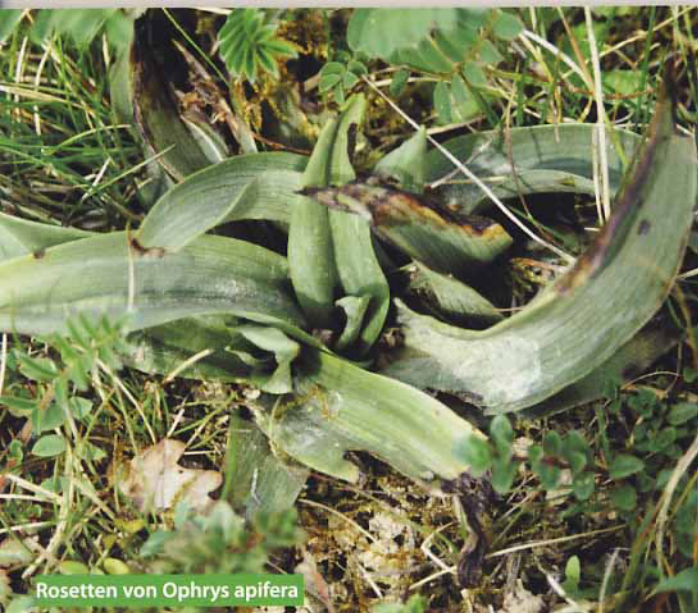
Rosetten von Ophrys apifera