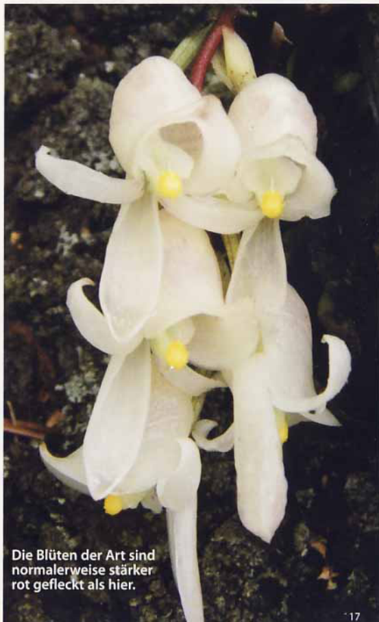
Die Blüten der Art sind normalerweise stärker rot gefleckt als hier.

Bisher sind nur sehr selten Schlimmias in Europa in Kultur gewesen. Daher sollte man das derzeitige Angebot nutzen, um diese auffallende und reizende Art in unseren Sammlungen zu etablieren.