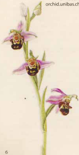
Ophrys apifera E. Nelson, orchid.unibas.ch

Die meisten blühenden Pflanzen waren bestäubt und bildeten Samenkapseln. Was die Entwicklung der Orchideen auf den Parzellen 1248 und 1031 betrifft, wäre es sinnvoll, die Mahdzeit vom 15. Juni auf den 15. Juli oder 1. August zu verschieben, um die Bildung der Samen maximal zu fördern.