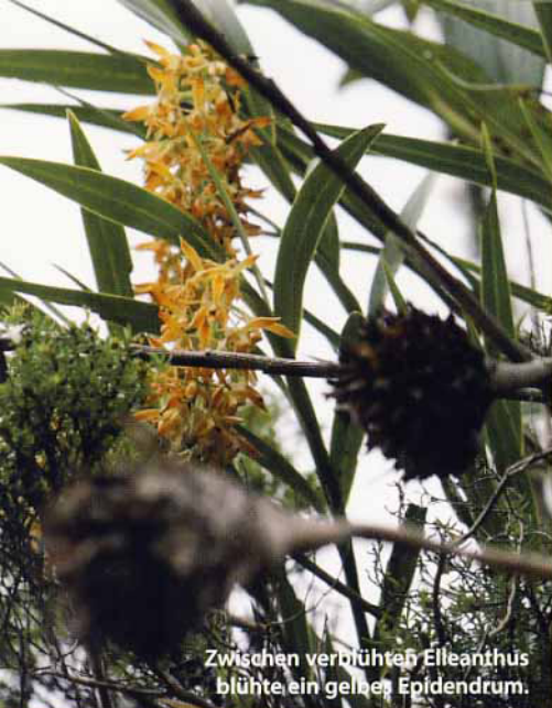
Zwischen verbühten Elleanthus blühte ein gelbes Epidendrum .