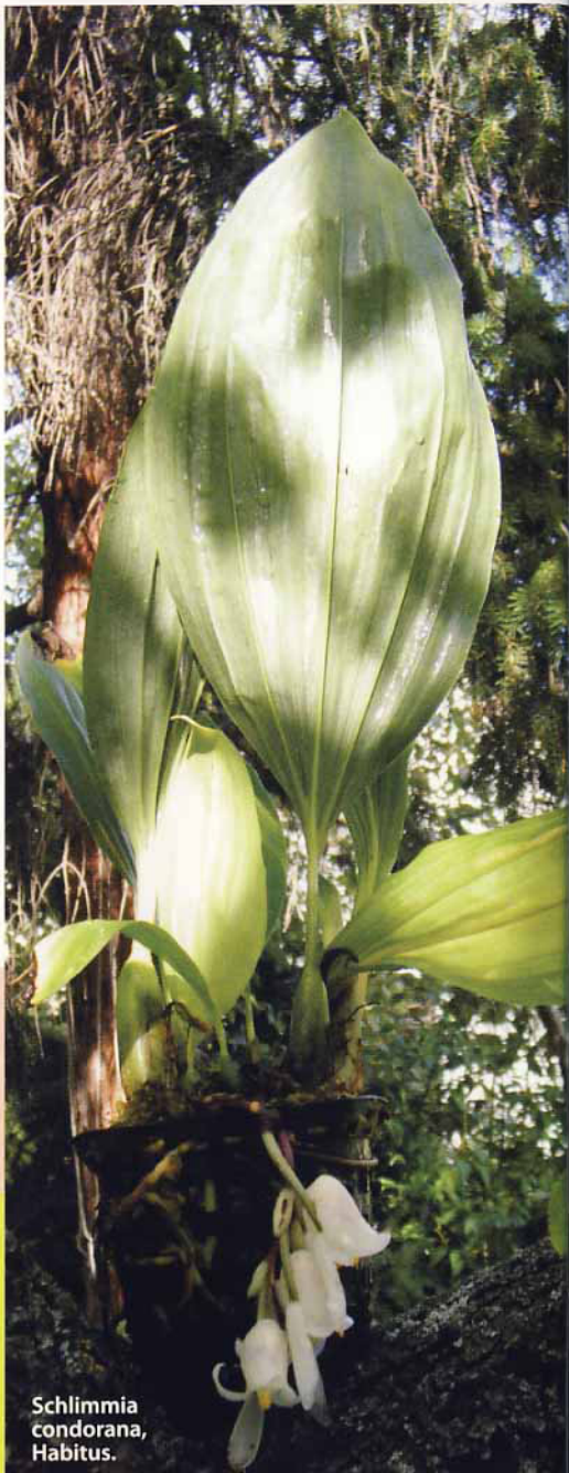
Schlimmia condorana, Habitus.

Im Internet habe ich außer dem botanischen Namen keine Hinweise auf die Beschaffenheit und Kultur dieser Pflanze gefunden.