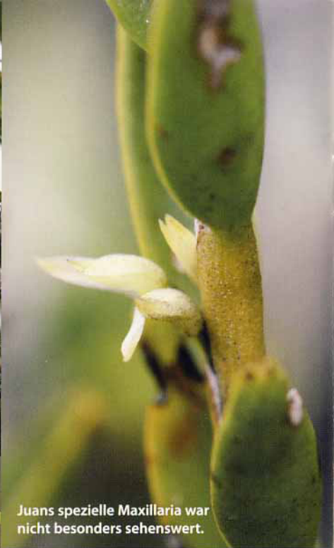
Juans spezielle Maxillaria war nicht besonders sehenswert.