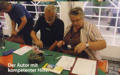
Der Autor mit kompetenter Hilfe.