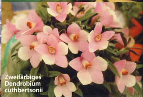
Zweifärbiges Dendrobium cuthbertsonii

sowie nur 15 cm hinter der Fensterscheibe. Das Paph. concolor steht unmittelbar daneben und erhält die gleiche Pflege. Beide Pflanzen erhalten den Großteil des Jahres volle Sonne, da weder Vorhang noch sonst eine Schattierung vorhanden sind. Gegossen wird zumeist mit Leitungswasser, welches eine Härte von 9 bis 11° dH bei einer Leitfähigkeit von rund 280 µS/cm aufweist. Gedüngt wird sehr selten, da beide Naturformen äußerst salzempfindlich sind. Der Pflanzstoff besteht aus einer Mischung von Piniennadeln und Lärchenrinde und enthält etwa 10 Vol-% Sphagnum, Perlite und Quarzsand. Aufgekalkt wird nicht, da unser Wasser offensichtlich ausreichend Calcium enthält, aber spätestens nach 18 Monaten wird umgetopft.