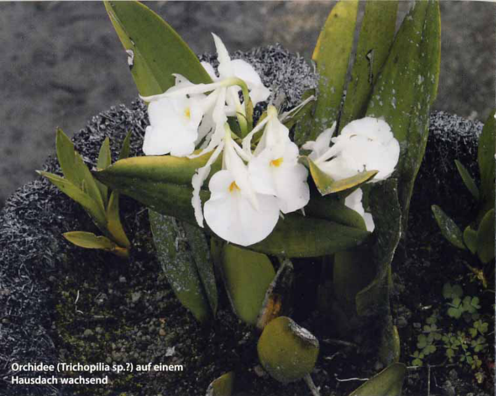
Orchidee ( Trichopilia sp.?) auf einem Hausdach wachsend

bedeutungs- und ausdruckslosere Art zu finden als diese. Ihre Blüten waren klein und von fahlgelber Farbe. Wahrscheinlich war es eine cleistogame Art, die sich selbst bestäubt, weil sich keine ihrer Blüten ordentlich öffnete.