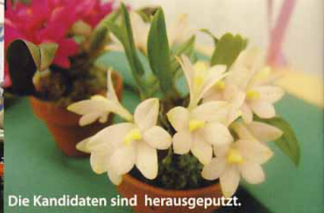
Die Kandidaten sind herausgeputzt.