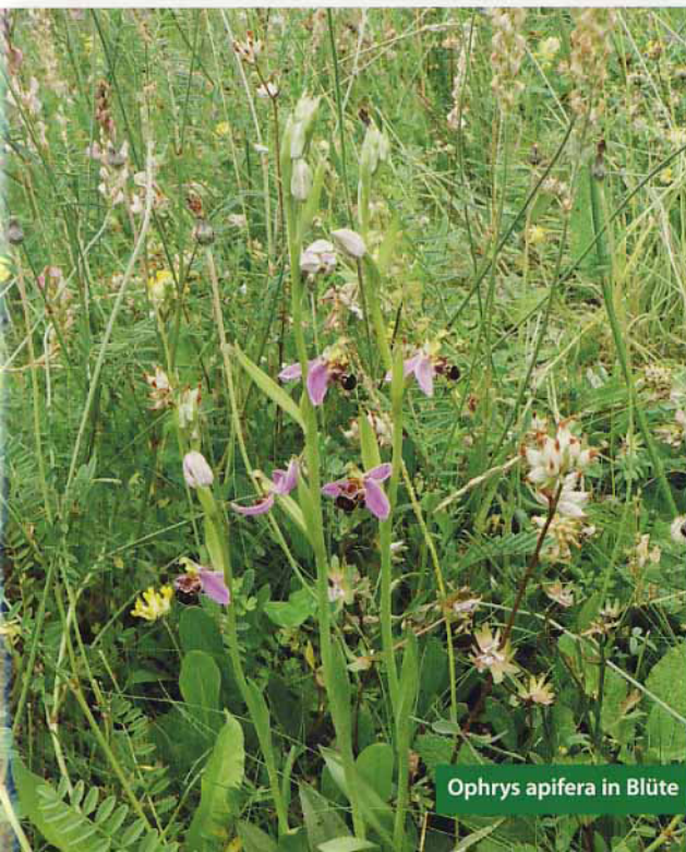
Ophrys apifera in Blüte

Die Liste der Pflanzen der Samenmischungen der UFA-Samen, welche im Text erwähnt sind, findet man auf der Internetseite: www.ufasamen.ch