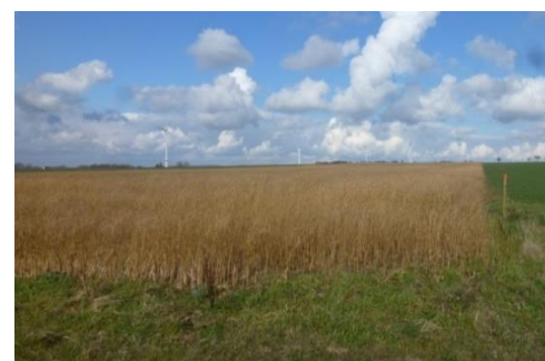
geplante Maßnahmenfläche T-A 4.1 und T-A 6.1: Anlage von 3 Feldgehölzen in Verbindung mit ortolangerechter Feldbewirtschaftung bzw. übergangsweise artenreichen Blühstreifen