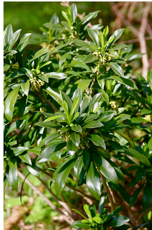
Der immergrüne Lorbeer-Seidelbast Daphne laureola ist ein immergrüner Kleinstrauch für naturnahe Gärten.

heimischen 26 Arten der Wildrosen ( Rosa spp.). Speziell wertvoll für kleine Gärten ist dabei die auch im Schatten duftend karminrosa blühende und fast stachellose Alpen-Hagrose ( Rosa pendulina ). Meist unter eineinhalb Meter Wuchshöhe erreichend, sind die kleinblättrigen Schattensträucher Schwarze, Alpen- und Blaue Heckenkirsche ( Lonicera nigra, alpigena, caerulea ), Alpen-Johannisbeere ( Ribes alpinum ), Stachelbeere ( Ribes uva-crispa ), Gewöhnlicher und Lorbeer-Seidelbast ( Daphne mezereum und laureola , letzterer immergrün).