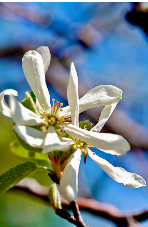
Felsenbirne Amelanchier ovalis