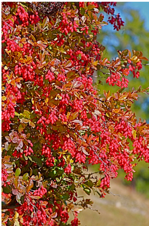
Die Wilde Berberitze Berberis vulgaris vereint schmückendes Herbstlaub und essbare Früchte