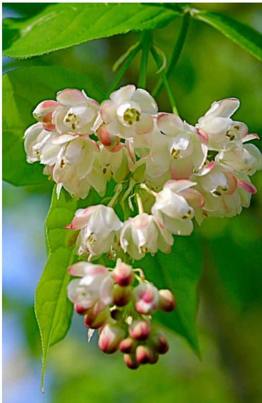
Duftende Blüten der heimischen Pimperness Staphylea pinnata