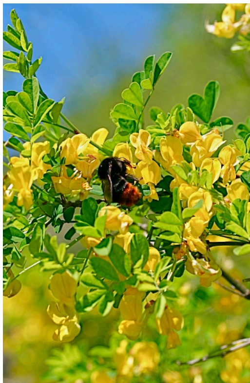
Strauch-Kronwicke Hippocrepis emerus