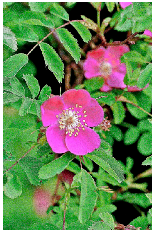
Alpen-Hagrose Rosa pendulina

Flächen mit hohem Sichtschutzbedarf und/oder mehr Platz erhalten nach hinten gestuft ansteigende Strauchgruppen mit Kleinsträuchern im Vordergrund. Bei engen Platzverhältnissen ergibt das vielleicht Gruppen von nur zwei bis fünf Sträuchern. An Stellen wo Lichteinfall, Durchblick oder Fernsicht gefragt sind, werden die Strauchgruppen unterbrochen, vielleicht auch nur mit niederwüchsigen Kleinsträuchern oder mit dem vorgelagerten, von Strauchgruppe zu Strauchgruppe durchlaufenden Krautsaum angedeutet. So können im Raum gestaffelte, abwechslungsreiche Heckenbilder mit unterschiedlichen Strauchgruppen gestaltet werden, welche den (beschränkten) Gartenraum vorteilhaft betonen und aufwerten, statt als monotone Mauer den Gartenraum zu blockieren.