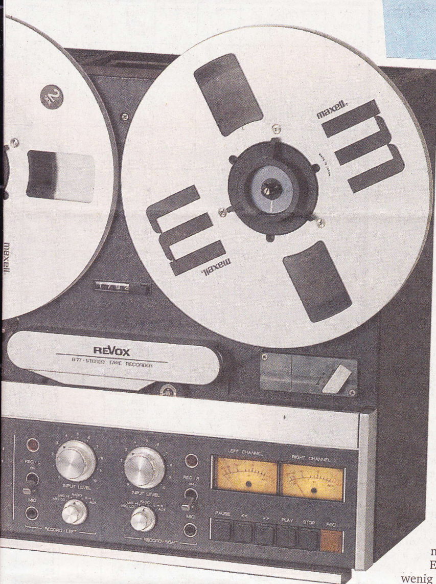
Auf Revox-Bandmaschinen haben Pink Floyd ihre Alben abgemischt.