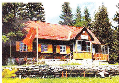
Johann Waller Hütte Tel. 0699/818 85 341