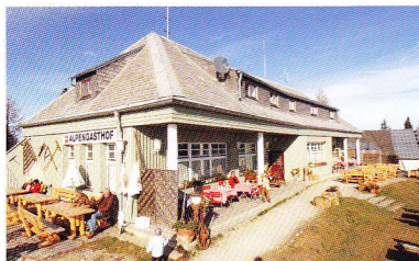
Alpengasthof, Tel. 03132/23 34