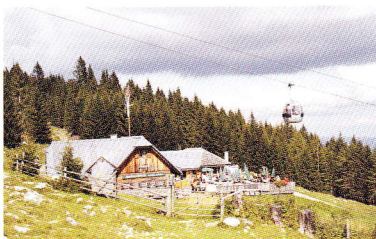
Halterhütte, Tel. 03132/23 23