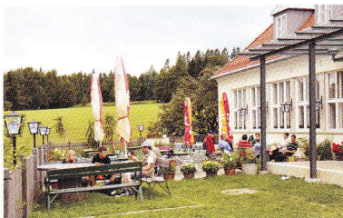
Schöcklstube Talstation, Tel. 03132/21 653