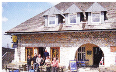
s' Wirtshaus am Schöckl Tel. 03132/44 23