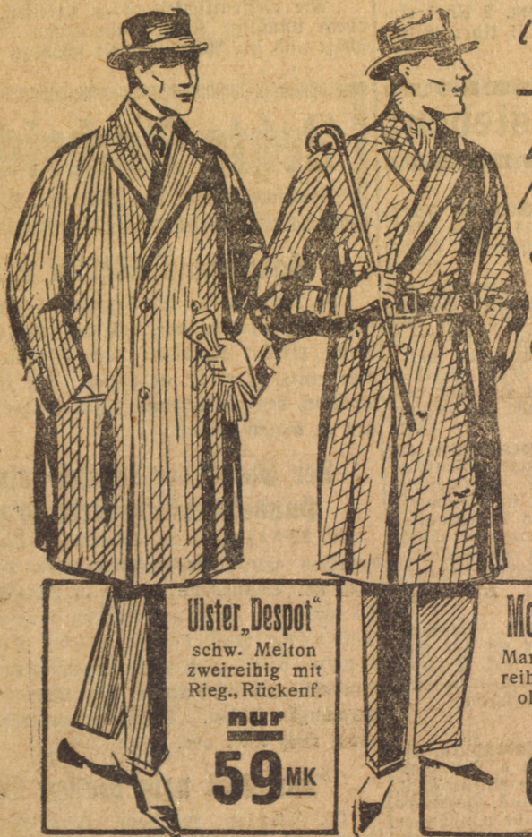
Ulster „Despot“ schw. Melton zweireihig mit Rieg., Rückenf.

Gardinen-Teppiche-Läuferstoffe-Divan-Tisch und Steppdecken