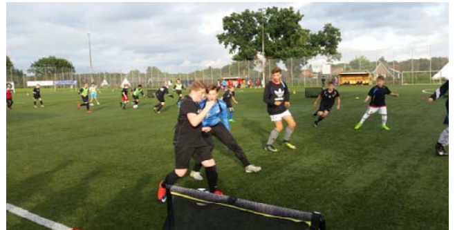
Real Madrid Demo Training