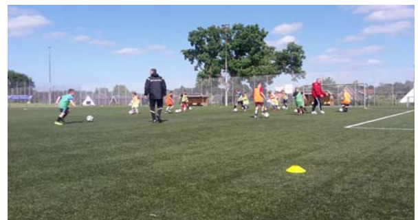
DFB-Mobil G- und F-Jgd