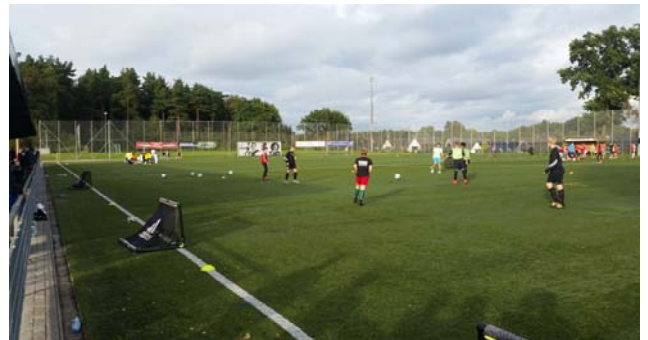
Real Madrid Camp 2018