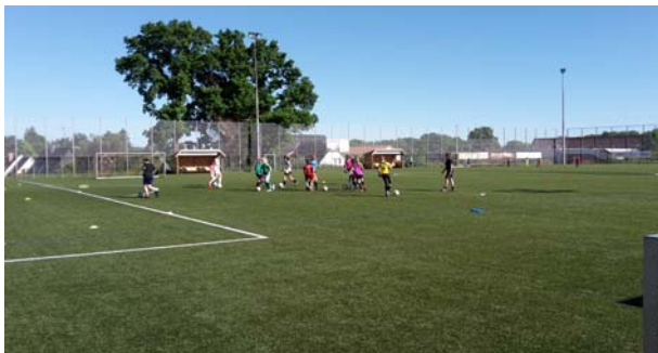
DFB Demo Training Mädchen