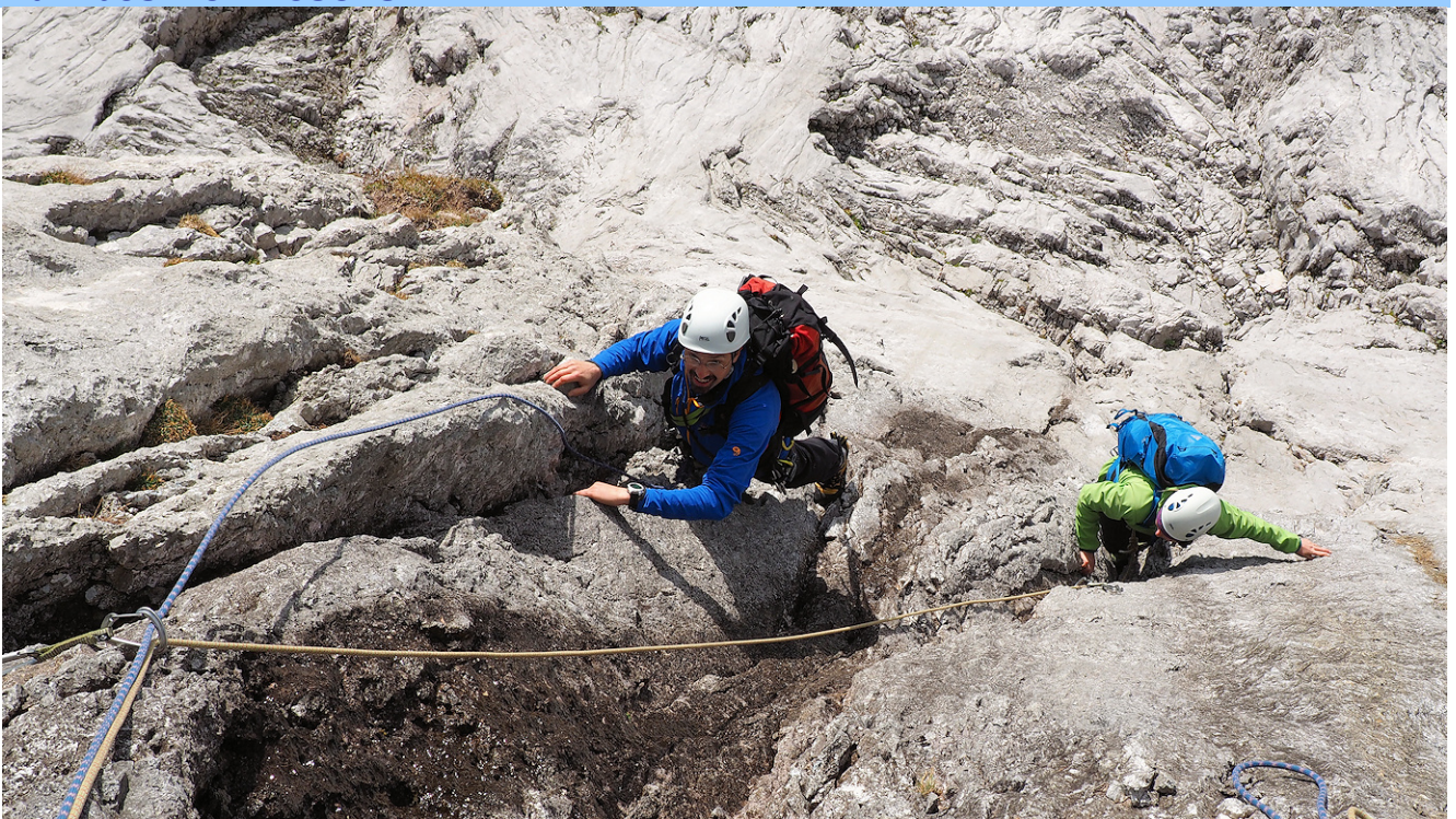
Im schwarzen Riss der Einstiegslänge (6-)

Charakteristik: Beliebte Route in der Hochschwabsüdwand mit abenteuerlichem Beginn (1. SL meist nasser Einstiegsriss – 2. SL abdrängende moosige Verschneidung), danach herrliche Plattenlängen – oft garniert mit Wasserrillen. Die Route wurde zwar mit Schwerlastankern saniert, hat aber ihren alpinen Charakter bewahrt (kleinere Runouts, keine Plaisirroute). EB F. Schabelreiter / H. Repolusk 1985