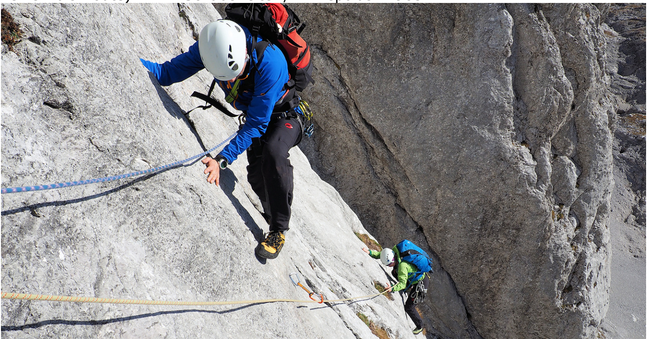
In den herrlichen Platten der 3. Seillänge (6-)

Charakteristik: Beliebte Route in der Hochschwabsüdwand mit abenteuerlichem Beginn (1. SL meist nasser Einstiegsriss – 2. SL abdrängende moosige Verschneidung), danach herrliche Plattenlängen – oft garniert mit Wasserrillen. Die Route wurde zwar mit Schwerlastankern saniert, hat aber ihren alpinen Charakter bewahrt (kleinere Runouts, keine Plaisirroute). EB F. Schabelreiter / H. Repolusk 1985