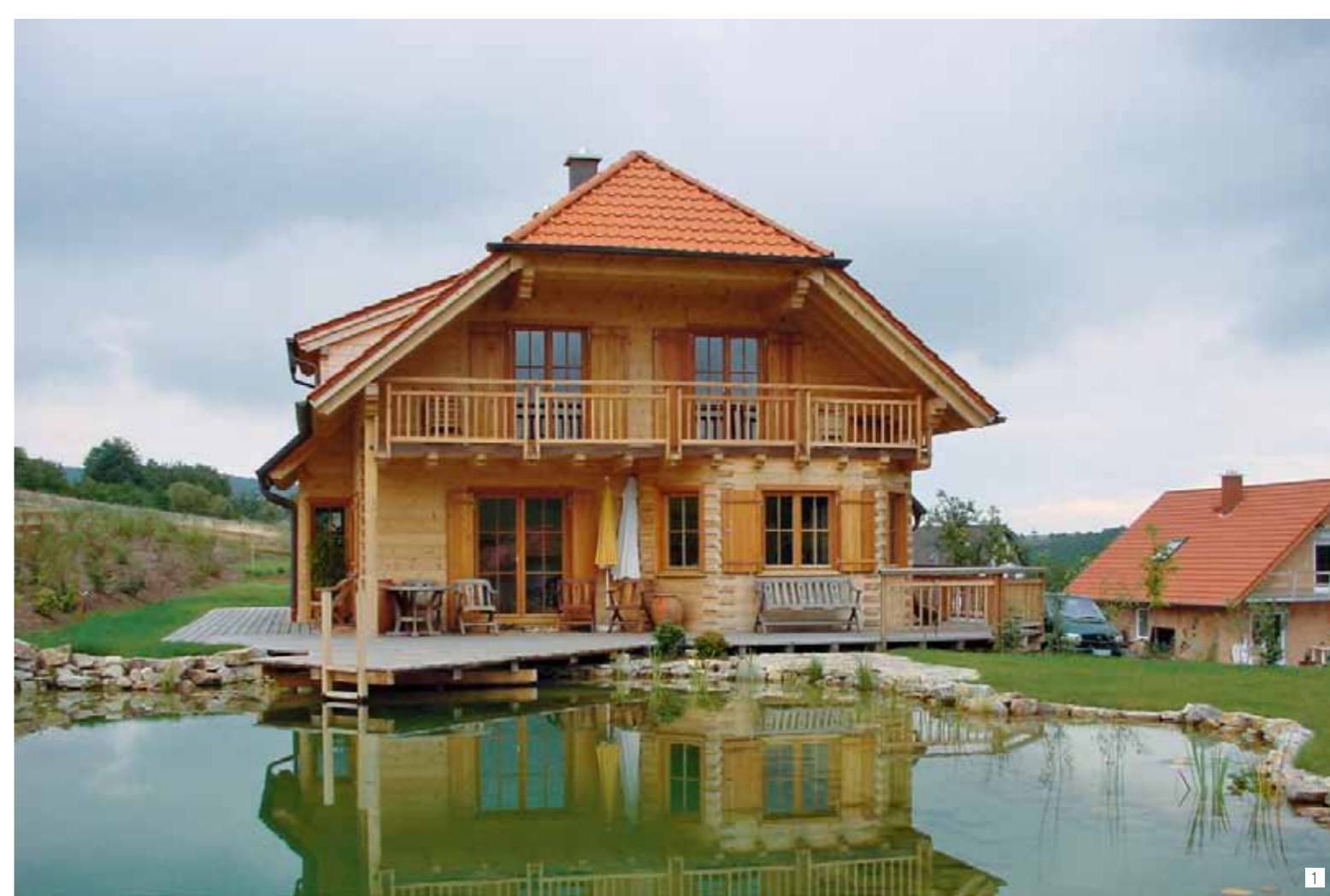
Bild 1: Wohnhaus Wenz bei Koblenz in Deutschland ▶ Bild 2: Wohnhaus Schäfer in Raggal Bild 3: Wohnhaus Schwendinger in Meiningen