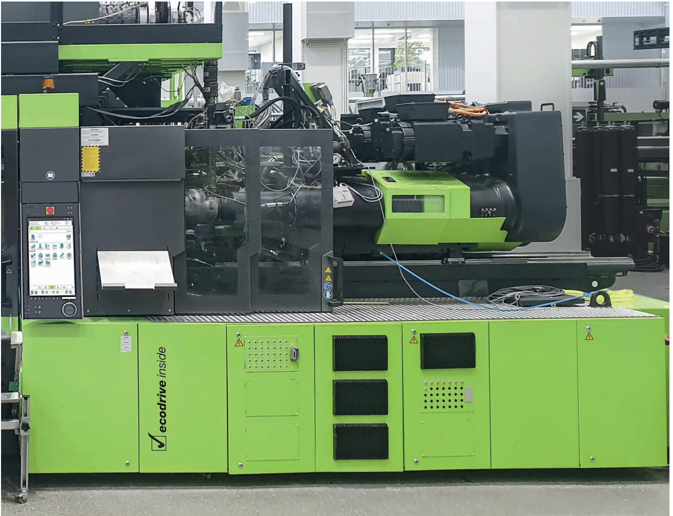
Versuchsanordnung im Technikum in St. Valentin: Für das Zwei-Stufen-Verfahren kombiniert Engel eine Plastifizier- mit einer Einspritzschnecke.

Entgasung im Zwei-Stufen-Prozess steigert Effizienz von Recyclingprozessen