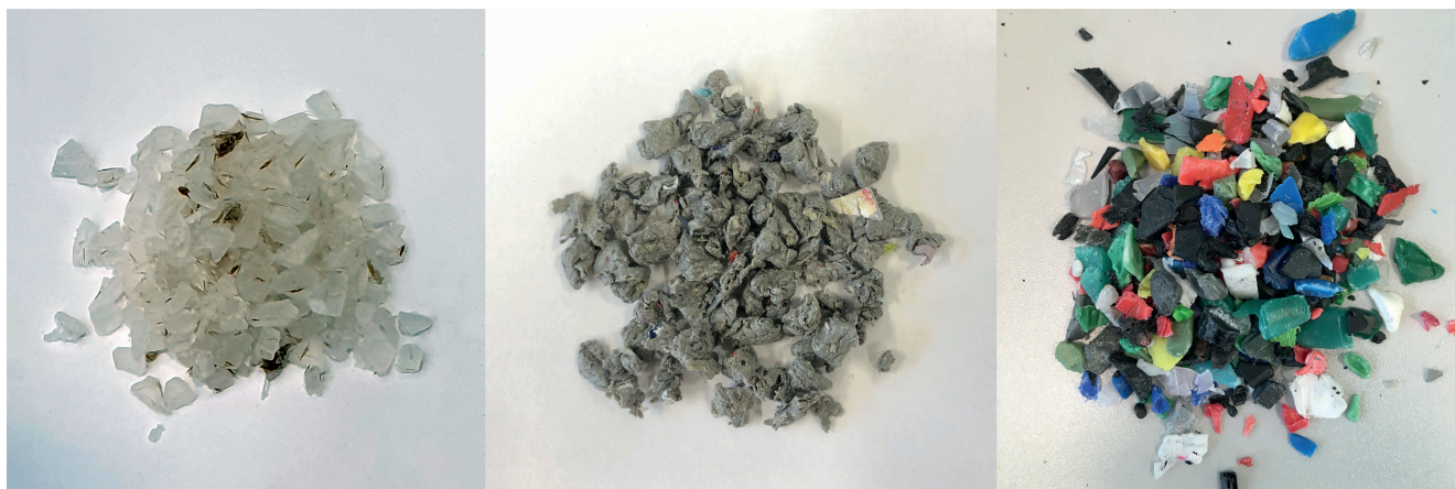
Bild 1. Die Versuche wurden mit drei unterschiedlichen Materialien durchgeführt: Granulat aus PP-Neuware (links), PP-Agglomerat aus Post-Consumer-Folien (Mitte) und Mahlgut aus PE-HD-Getränkeverschlüssen (rechts).

Produkte erhalten. Üblicherweise werden Kunststoffe aus Post-Consumer- und Post-Industrial-Sammlungen nach dem Sortieren und Reinigen gemahlen, compoundiert und granuliert und als Regranulat in die Spritzgießverarbeitung gegeben. Der Kunststoff muss also zwei Mal aufgeschmolzen werden.