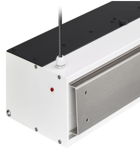
Wall mounting plate and indicator light