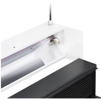
Access to lamp and product maintenance