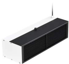
UV-C disinfection upper air Wall mounted version high output