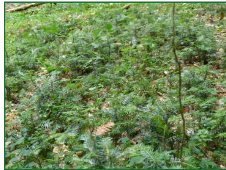
Weißtannenverjüngung aus Saat

Durch die Einbringung der Weißtanne in Form von Saat lässt sich eine hohe genetische Vielfalt erhalten und lassen sich Pflanzen erziehen, die aufgrund natürlicher Selektionsmechanismen ideal an die Bestandesbedingungen angepasst sind. Zudem wird die gewünschte Ausbildung des Pfahlwurzelsystems in keinsten Weise beeinträchtigt (Wald und Holz NRW 2017).