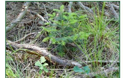
Weißtannen- und Eichen-Naturverjüngung

Die Etablierung der Weißtanne und das dauerhafte, jagdlich interessante Vorkommen von Rot-, Dam- oder Muffelwild als Standwild schließen sich aus. Auf eine intensive Rehwildbejagung ist gleichsam zu achten. Im Zusammenhang mit der Etablierung von Weißtanne haben sich Jagdmodelle wie Regie- oder Prämiensjagdsysteme (z. B. erfolgreiche Jäger zahlen weniger) bewährt (Schusser 2018). Jagd wird vom Hobby zu einer zentralen waldbaulichen Aufgabe.