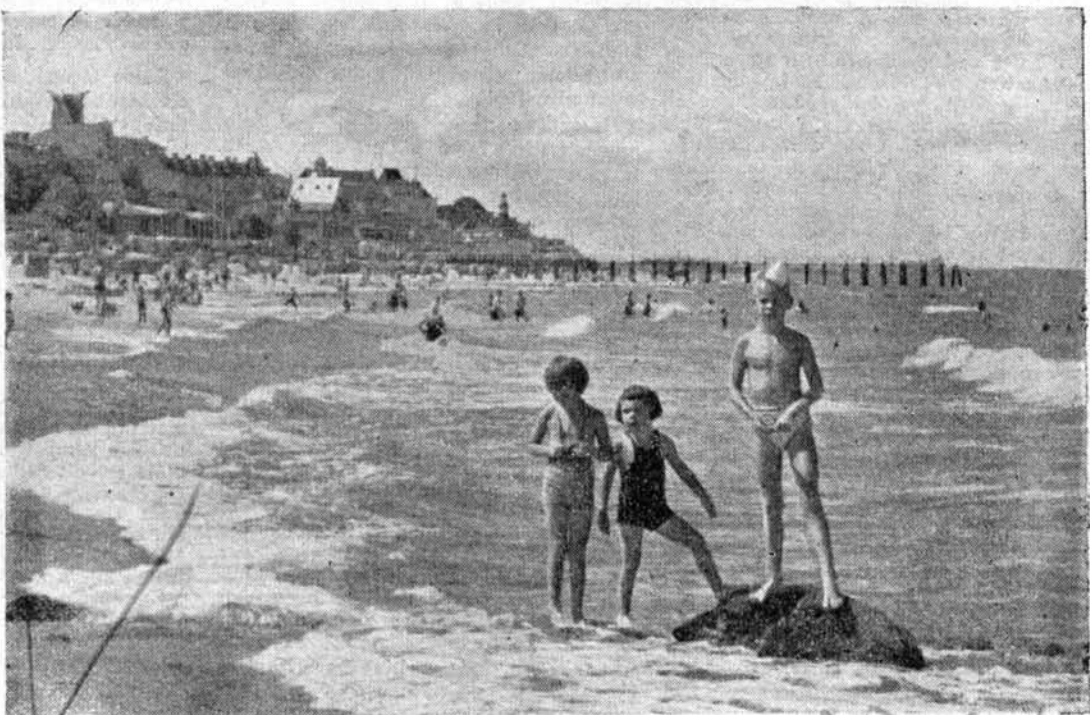
In dem klaren, kühlen Wasser der Ostsee zu baden

Ein Gasthaus in Nidden nimmt uns auf. Am Haffufer liegen die Kähne der