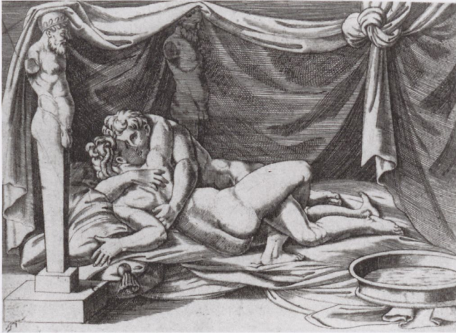
9 Agostino Veneziano (?) nach Marcantonio Raimondi, sog. Position 1 der Modi, um 1525/40, London, British Museum

den Text auf Flötners berühmtem Holzschnitt des Landsknechts „Veit Bildhauer“ stark machen, wo angesichts der Reformations- und Kriegswirren als einzige berufliche Perspektive eines Bildhauers Porträts und (man darf ergänzen: antike?, erotische?) Akt-darstellungen in italienischem und deutschem Stil angeführt werden: