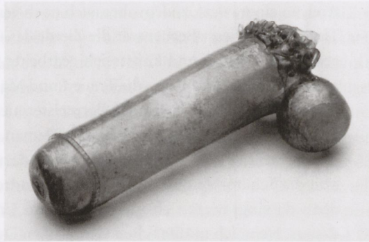
10 Glasphallus aus dem Damenstift Herford, 16. Jh., Herne, LWL-Landesmuseum für Archäologie

Bereits die Humanisten brachten die beiden Aussagen der Plinius-Passage („lüsterne Bilder einzugraben“ und „aus obszönen Geschirren trinken“) mit anderen antiken Quellenbelegen zur Wirkmacht erotischer Bilder im Zusammenhang von Trink-Wettbewerben und zu Gläsern in Phallus-Form zusammen. 40 Solche phallusförmige Trinkgefäße haben sich aus der Antike offenbar nur in Ton erhalten. 41 Pietro Aretino beschreibt dann in seinem Ragionamento (1534) für Italien den Einsatz gläserner, mit warmer Flüssigkeit gefüllter Dildos in einem Frauenkloster. 42 Und nördlich der Alpen wurde nahe der Kammer der Äbtissin im Kloster Hersfeld tatsächlich ein gläserner Phallus aus dem 16. Jahrhundert gefunden, der entweder für Trinkspiele oder aber zur Selbstbefriedigung dienen konnte (Abb. 10). 43