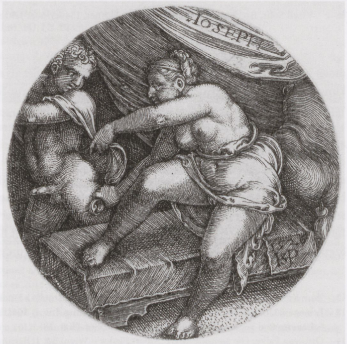
5 Sebald Beham, Joseph und Potiphars Weib, Kupferstich, 1526, Braun- schweig, Herzog- Anton-Ulrich- Museum