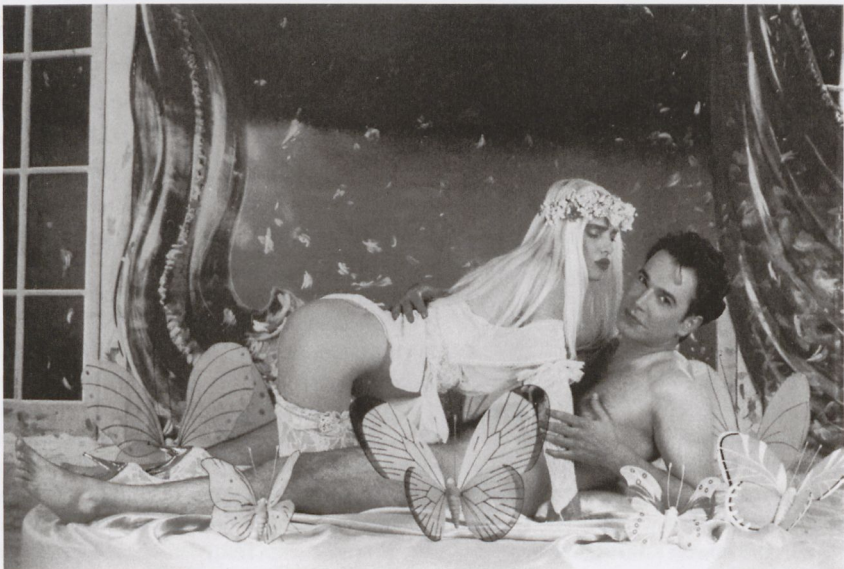
1 Jeff Koons, Ilona on Top (Rosa Background) , aus der Serie Made in Heaven , 1990, Privatsammlung

Jeff Koons Werkserie Made in Heaven aus den Jahren 1990/91 stellt in vieler Hinsicht den Höhe- und Endpunkt eines künstlerischen Anliegens dar, das seit den 1960er Jahren mit Sexualität und dann auch Pornographie arbeitete. Koons zeigt – in einer Reihe von foto-realistischen Gemälden und Skulpturen unterschiedlicher Materialität und Größe – vor allem verschiedene Momente des Geschlechtsverkehrs des Künstlers mit dem Porno-Model Cicciolina (Ilona Staller, die Koons 1991 heiratete) in einer an damalige Sexfilme und Vergnügungsetablissemments angelehnten Bildästhetik (Abb. 1). Die Transgression