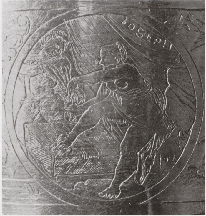
4b Joseph und Potiphars Weib, Detail aus Abb. 4a