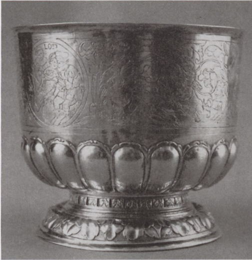
4a Becher mit gravierten erotischen Bibel-Szenen, 1537, Berlin, Staatliche Museen – Kunstgewerbemuseum

Die Gegenüberstellung der beiden Flötner-Kokosnussbecher verdeutlicht ein Weiteres: Kokosnuss war nicht nur ein exotisches Material, dem Gift-bindende Wirkung