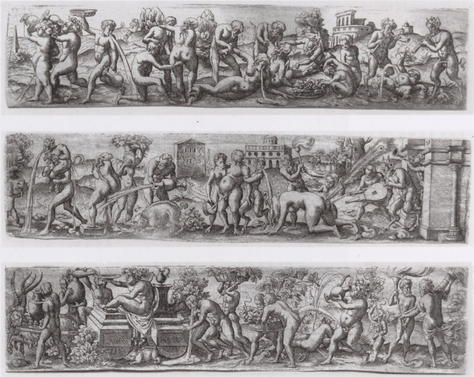
6a–c Virgil Solis, Bacchische Szenen nach Peter Flötner, 1540er/50er Jahre

dieser Hinsicht wird die Überwindung von Natur und Kunst als maximale künstlerisch-künstliche Leistung inszeniert, die sich freilich im Anblick zunächst einmal selbst ganz verbirgt: Ars est celare artem . 12