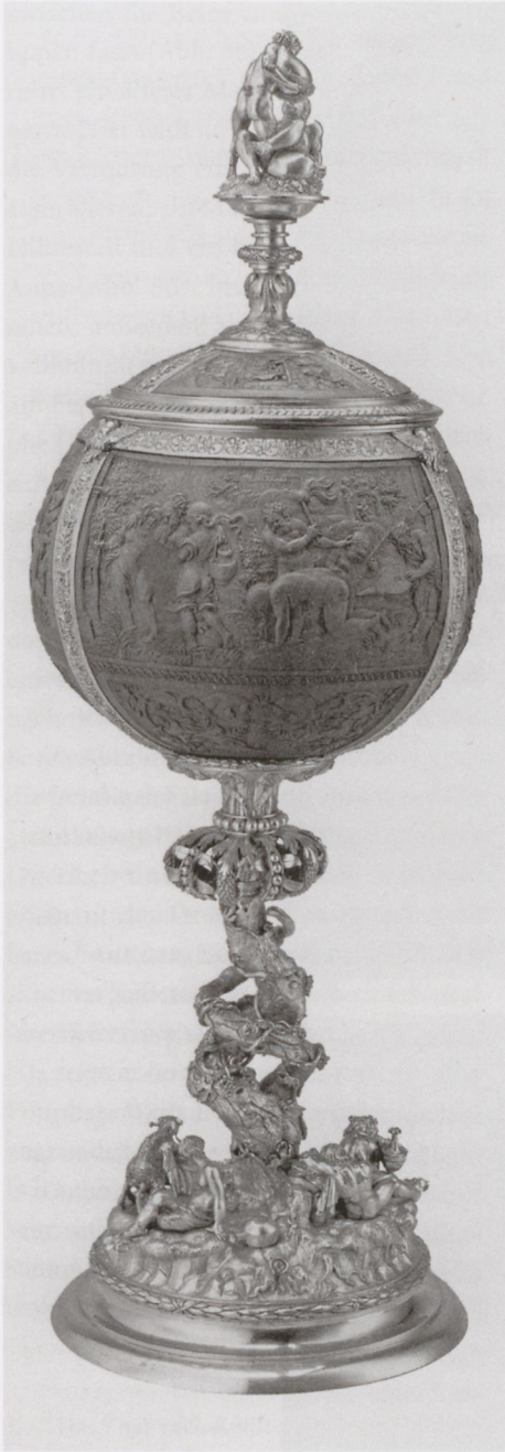
2a Peter Flötner und Melchior Baier (?), Kokosnusspokal der Familie Holzschuher, 1537–1541, Nürnberg, Germanisches Nationalmuseum