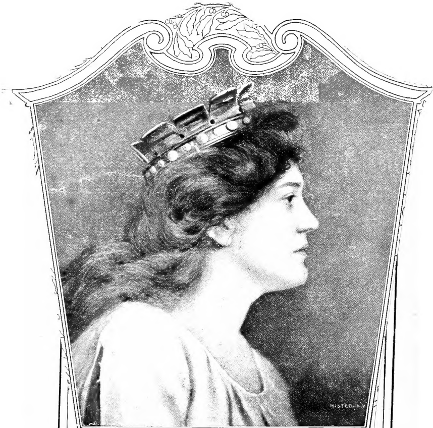
NADAME NORDICA AS ISOLDE