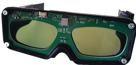
Abbildung 1: Bestehender Prototyp des mobilen EEG-Biofeedback-Systems