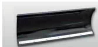
SCHNEERÄUMEN ISEKI Schneeschild mit 1.200 mm Arbeitsbreite