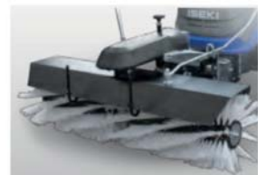
KEHREN Frontkehrmaschine mit 1.200 mm Arbeit