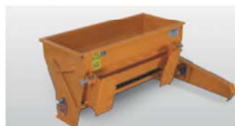
STREUEN ISEKI-Aufsattelkastenstreuer mit 80 l Streuvolumen und 800 mm Arbeitsbreite