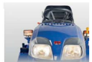
STVZO BE [Betriebslaubnis]