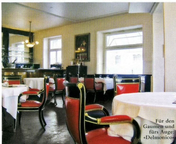
Für den Gaumen und fürs Auge: «Delmonico»

★ Restaurant Delmonico, Hopfenstrasse 19, 8045 Zürich, Tel. 044 450 55 88, www.restaurant-delmonico.ch