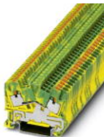
Schutzleiter-Reihenklemme, Anschlussart: Push-in-Anschluss, Querschnitt: 0,14 mm 2 - 4 mm 2 , AWG: 26 - 12, Breite: 5,2 mm, Farbe: grün-gelb, Montageart: NS 35/7,5, NS 35/15

Bitte beachten Sie, dass die hier angegebenen Daten dem Online-Katalog entnommen sind. Die vollständigen Informationen und Daten entnehmen Sie bitte der Anwenderdokumentation. Es gelten die Allgemeinen Nutzungsbedingungen für Internet-Downloads. ( http://download.phoenixcontact.de )