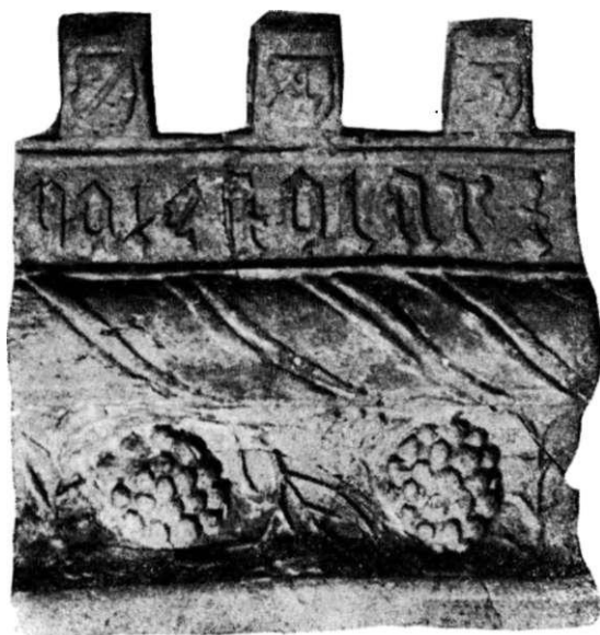
Obr. 2. Celní vyhřívací stěna jednoho ze studovaných kachlů.