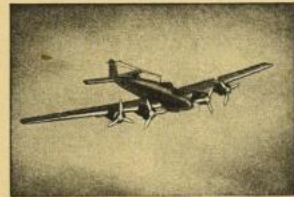
Fernbomber „Focke-Wulf Kurier“

Bisher sind folgende Baupläne erschienen: