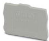
Abschlussdeckel, Länge: 33,6 mm, Breite: 2,2 mm, Höhe: 22,3 mm, Farbe: grau