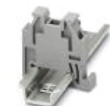
Schnellmontage-Endhalter, zum Aufrasten auf Tragschiene NS 15