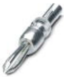
Prüfstecker, mit Lötanschluss bis 1 mm 2 Leiterquerschnitt, Farbe: grau