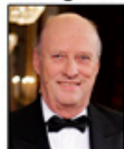
Kong Harald V

Løsning ordporm: Bokstavene du sitter igjen med danner ordet ELEV.