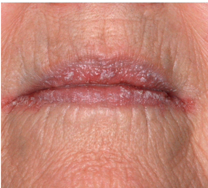
Oral candidos kan förekomma även i munvinklarna – "munvinkelragader".