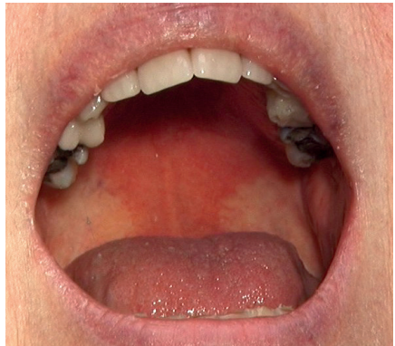
Erytematös candidos - "den röda svampen"