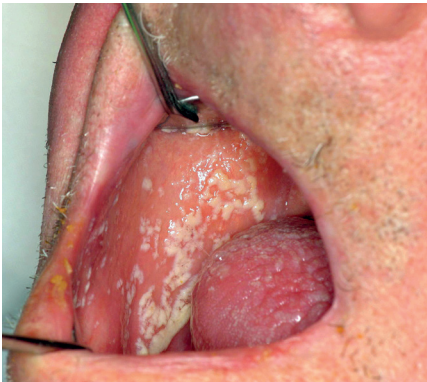
Pseudomembranös candidos - "den vita svampen även kallad torsk"

Idag talar vi i huvudsak om två typer av oral candidos: