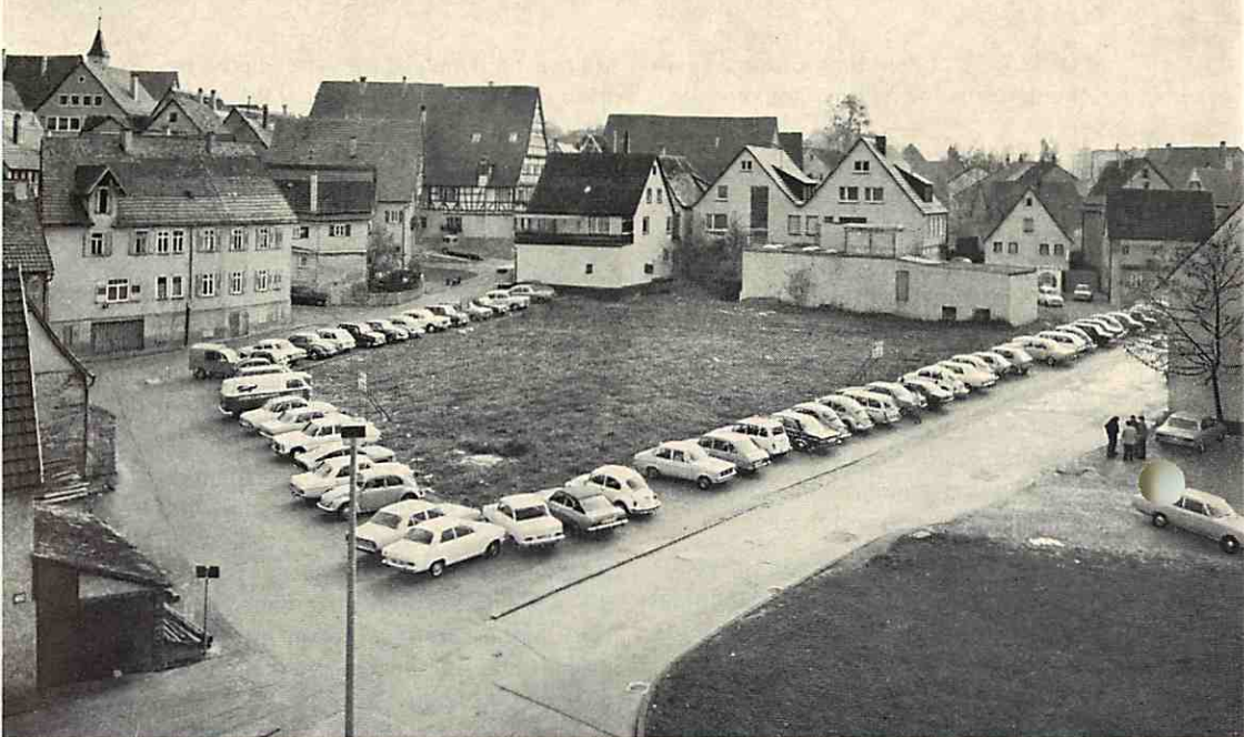
Der Kahlschlag zwischen Badgasse und Seestraße — erster Schritt der Herrenberger Altstadtanierung.