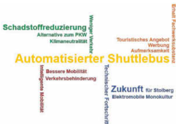
Wortwolke zum automatisierten Shuttlebus

Abschließend sind die wichtigsten Assoziationen zum automatisierten Shuttlebus in Abbildung 5 zusammengefasst.