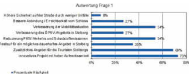
Auswertung Frage 1

Abschließend ist zu erwähnen, dass eine höhere Sicherheit auf der Straße kein besonderes Argument für die Einführung eines automatisierten Shuttlebusses zu sein scheint (8 %).