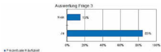
Auswertung Frage 3

Anhand der Auswertung der dritten Frage zeigt sich die positive Stimmung zum Projekt. Die Teilnehmer*innen sollten sich entscheiden, ob sie aktuell in einen automatisierten Shuttlebus einsteigen würden. Laut der Auswertung würden dies nach jetzigem Stand 85 % der Personen tun (siehe Abbildung 3).