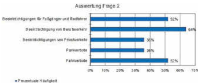
Auswertung Frage 2

Bei genauerer Betrachtung ist jedoch zwischen Fahrverbote für Durchgangsverkehr und Fahrverbote für Anwohner*innen zu unterscheiden. Letztere wird es definitiv nicht geben. Am wenigsten wichtig werden Beeinträchtigungen für den Privatverkehr und Parkverbote angesehen (jeweils 36 %). Dies stützt die Idee Parkverbote einzuführen, wobei auch hier zwischen Touristen und Anwohner*innen unterschieden werden muss.