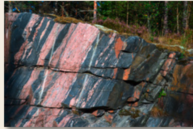
Migmatit in Südschweden