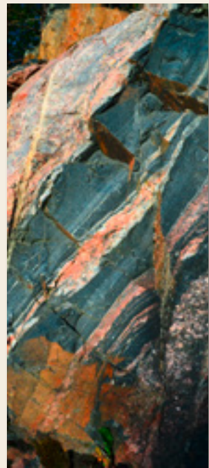
Migmatit in Südschweden

Oft finden wir Gneise, die „Adern“ enthalten. Sie können mehrere Zentimeter breit sein. Sie sind immer hell und bestehen aus Quarz und Feldspat. Innerhalb dieser Adern gibt es keine Streifung (Foliation) wie im umgebenden Gestein (dunkle Partien). Die Kristalle sind zufällig orientiert, wie in einem Granit.