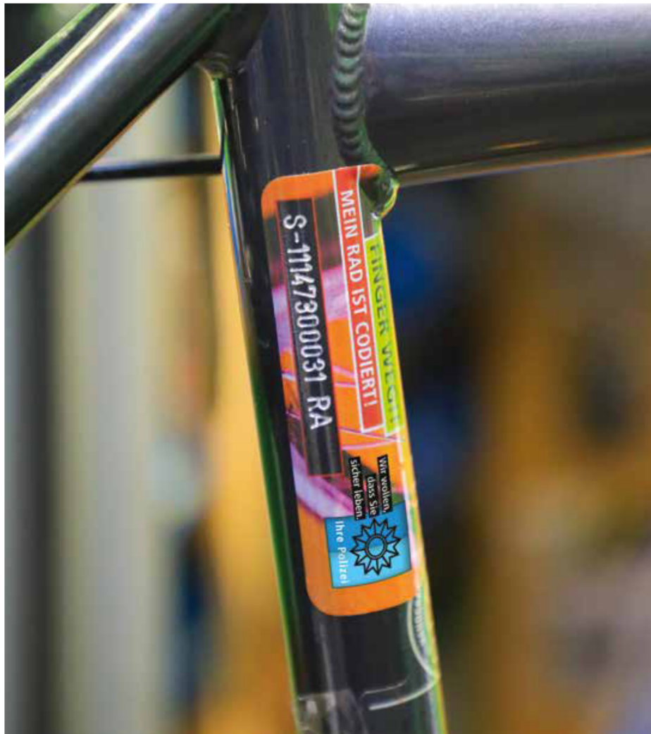
👉 Fahrrad mit Codierung am Rahmen.

Außerdem kann die Codierung abschreckend auf Diebe wirken: Denn über den Code lässt sich schnell feststellen, ob ein Radfahrer auch tatsächlich der rechtmäßige Eigentümer eines Rades ist. Zudem macht sie die Weitergabe und den Verkauf gestohlener Räder unattraktiv, da der Code nur sehr schwer zu entfernen ist.