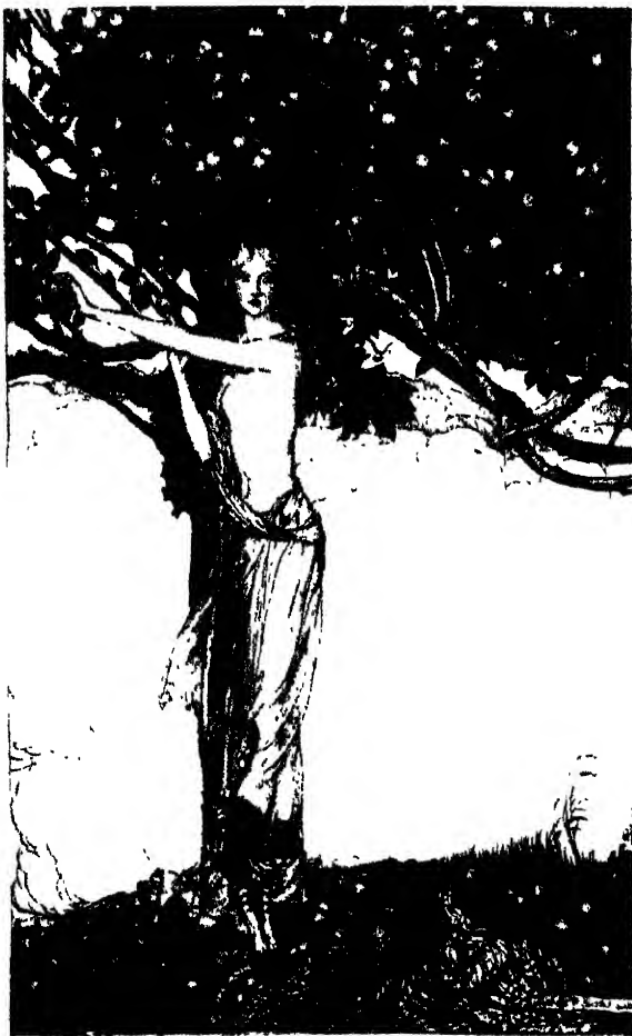
"TRIX, THE FAIR ONE"