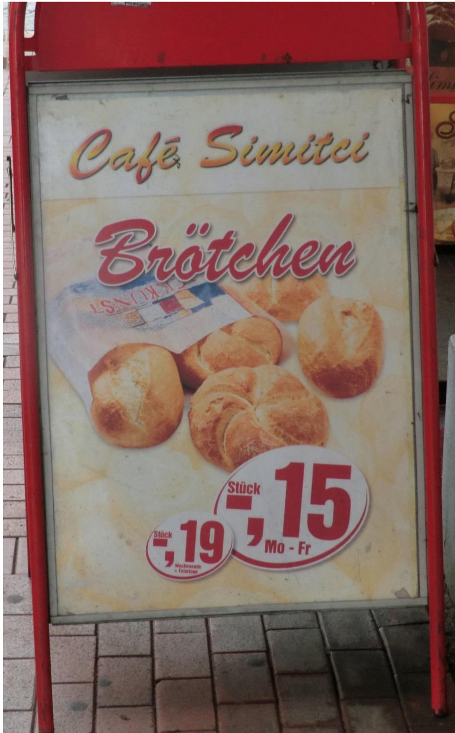
Abbildung 6: Aufsteller in DO-Nordstadt, 12.09.2013 (Nr. 1566)

Der transgressive Diskurs hingegen folgt nicht zweckorientierter Effizienz, buhlt aber sehr wohl um Aufmerksamkeit und gilt (außer bei manchen politischen Graffiti) vor allem der Expression und Selbstinszenierung häufig auch anonymen Personen und Gruppen. Der oft