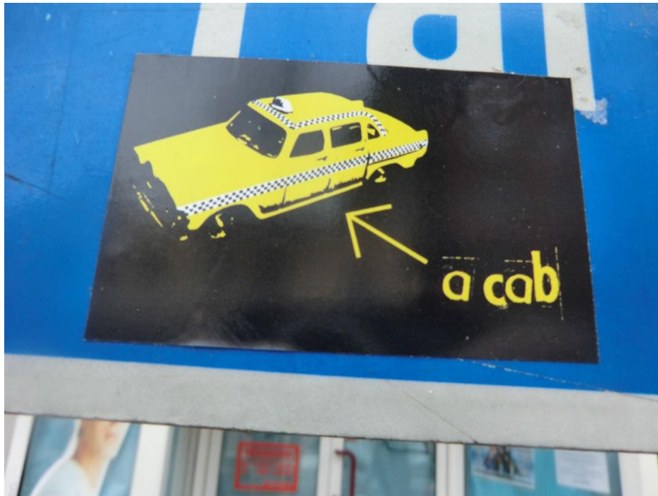
Abbildung 2: Aufkleber in Dortmund-Nordstadt, 25.9.2013 (Datenbank Nr. 7887)

Wer zum Beispiel in der Dortmunder Nordstadt 36 600 Meter der Münsterstraße (dicht bewohnt, teilweise verkehrsberuhigt, viel Einzelhandel, Gastronomie und Dienstleistungen) folgt, findet dort 17 schwarze Aufkleber mit gelben „a cab“-Taxis (wie in Abb. 2; Verteilung gemäß Abb. 3). 37