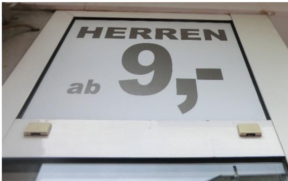
Abbildung 5: Laden-Eingang in DO-Nordstadt, 16.09.2013 (Nr. 4065)

Anders im kommerziellen Diskurs mit durchaus verschiedenartigen Erscheinungsformen. Da geht es keineswegs immer nur um Werbung, aber doch vorrangig um Aufmerksamkeit, Zuwendung und Einladung. Deshalb ist der ästhetische Aufwand, der hier getrieben wird, zwar ebenfalls zweckorientiert, jedoch für jeden einzelnen Fall neu – und je nach Situation und Anlass meistens auch größer als bei regulatorischen und infrastrukturellen Zeichen. Auch die Texte können etwas länger sein. Wählen wir auch hier wieder möglichst charakteristische Beispiele nur aus dem kleinen Gebiet der Karte in Abb. 3.