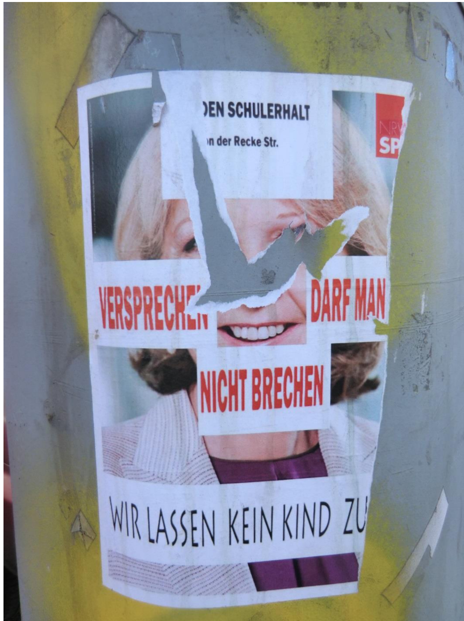
Abbildung 1: Kleines Plakat in Bochum-Hamme, 24.9.2013

Skala menschlicher Kommunikationsmöglichkeiten, behandeln wir hier in diesem Aufsatz das medial mehrfach vermittelte Foto als totes Objekt rationaler Betrachtung, nicht emotionaler Anteilnahme.