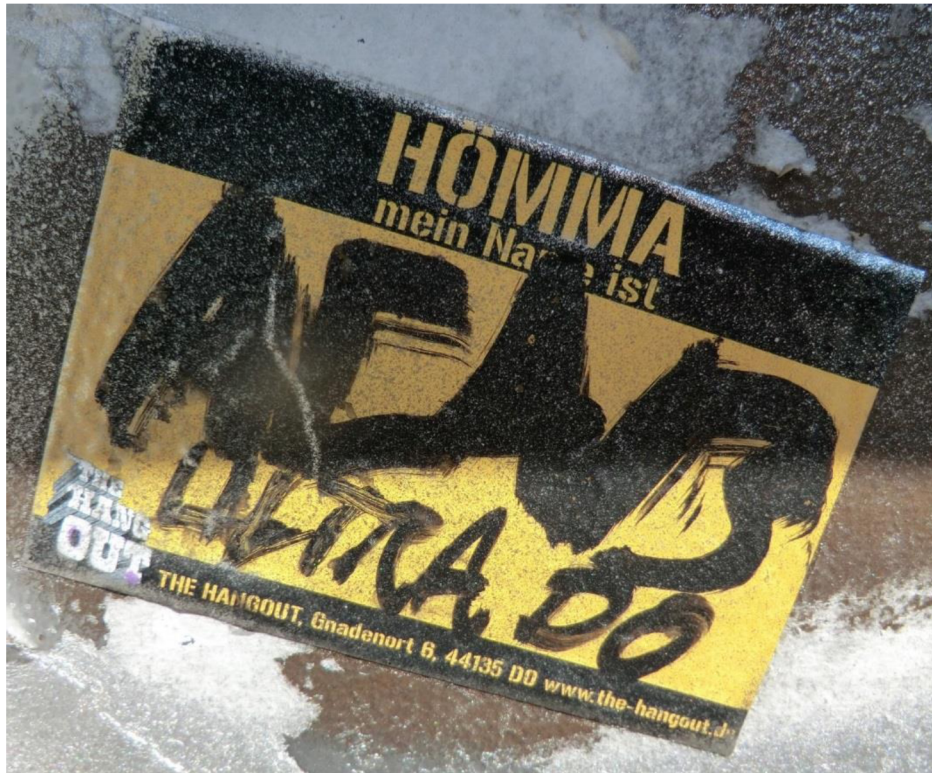
Abbildung 7: Aufkleber in DO-Nordstadt, 27.09.2013 (Nr. 9340)

Am meisten Text ganz ohne Bild steht auf dem rechteckigen blauen Aufkleber (9341) mit weißer und gelber Schrift: „Für mehr als nur dagegen! 2.0“ „1. Mai Dortmund“ „Gegen Deutschland & seine Nazis. Für den Kommunismus!“ Das sind 17 Wörter plus zwei Satzzeichen auf drei Teilflächen.