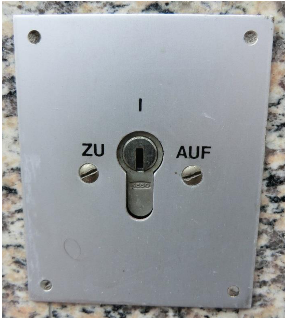
Abbildung 4: Schloss-Beschriftung in DO-Nordstadt, 16.09.2013 (Nr. 3982)

Wie sehen nun die sprachlichen Formen aus (also die fünfte Kategorie in der Liste oben in Abschnitt 2)?