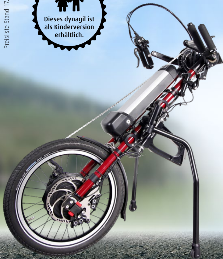
Die gezeigte Abbildung enthält Sonderausstattung