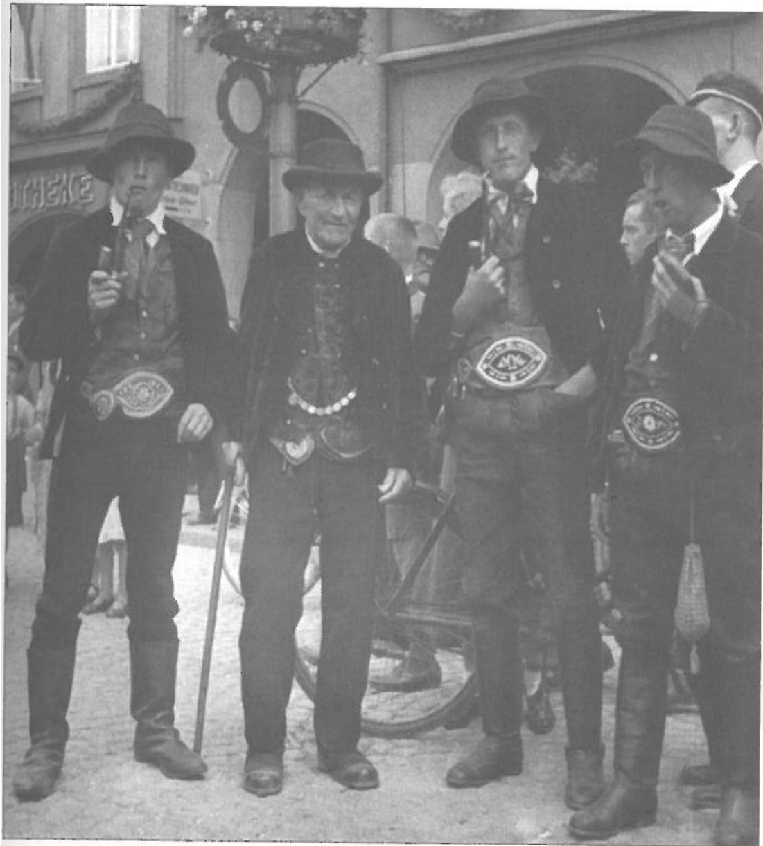
2 Abb. 2: Männertracht des Riesegerbirgsvorlandes