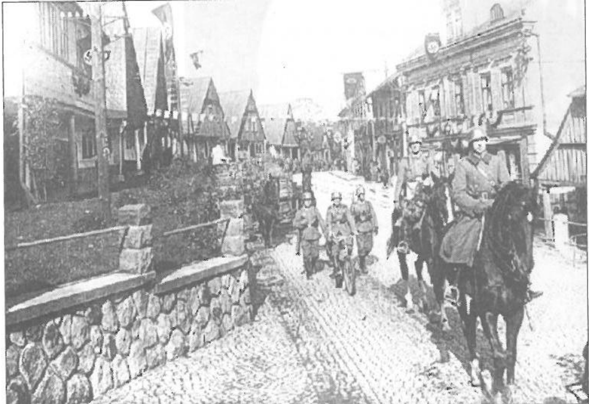
5 Abb. 5: Einmarsch der deutschen Truppen am 8. Oktober 1938 in Schatzlar