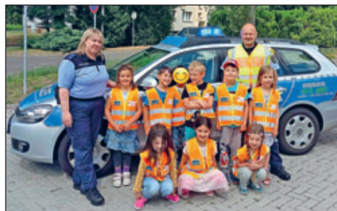
Die Schulanfänger aus dem Kunterbunt nahmen alle erfolgreich am Fußgängerführerschein teil

Am 11.07.2022 kam die ortansässige Polizei zu uns. Da sich unsere Schulanfänger bald auf den Weg in die Schule machen und einige bereits ab der 1. Klasse ihren Schulweg allein bewältigen werden, haben wir uns im Rahmen der Schulvorbereitung für den Fußgängerführerschein angemeldet. Bevor es richtig los gehen konnte, wurden die Verkehrszeichen ausführlich besprochen. Einige Kinder wussten schon sehr genau, welches Verhalten bei welchem Verkehrszeichen im Straßenverkehr gefordert ist. Einige Kinder benötigten auch etwas Unterstützung. Nachdem alle Verkehrszeichen und Verhaltensweisen durchgesprochen waren, gab es einen kleinen Test. Alle Kinder haben erfolgreich die Theorie abgeschlossen. Nun ging es in die Praxis. Aufstellen,