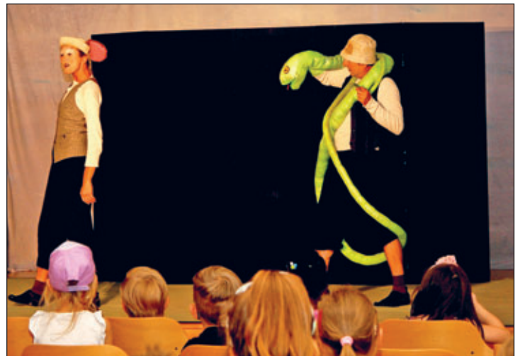
pohyps und Konsorten präsentieren den mit Spannung erwarteten Grüffelo