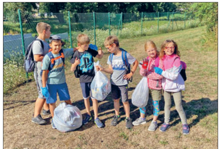
Das Ergebnis nach nur kurzer Zeit

Unsere Hortkinder hatten einen besonderen Ferientag unter dem Motto „Wir sammeln Müll“. Ursprünglich hatte sich das Team des Kinderhortes überlegt einen Waldtag mit den Kindern zu unternehmen. Gleichfalls hatten sich die Kinder im Vorfeld der Ferien Gedanken zur Gestaltung der schulfreien Zeit gemacht und sich überlegt auf dem Weg zum Flößberger Wald der Umwelt zu helfen und den Müll einzusammeln. So sind wir dann mit Handschuhen und Müllsäcken gut ausgerüstet losgezogen. Zum Erschrecken aller hatten wir schon nach kurzer Zeit unsere Müllsäcke übertoll. Den Müll haben wir entsprechend in Müllcontainern entsorgt.