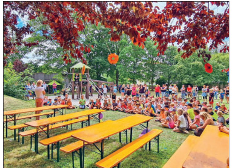
Gespannt hören die Kinder der Rede der Schulleiterin zu.

Der Heiße Draht sorgte ebenfalls mit dem Wasserstrahl bei einem kleinen Fehler für eine Überraschung. Für die Kreativen gab es eine buntgemischte Bastelstraße sowie eine Seifenblasenstation, welche zum Schluss ein wunderbares Seifenblasenbild entwickelte. Besonders beliebt war das Kinderschminken, wo die Horterzieherinnen und die Lehrerinnen die Kinder in Schmetterlinge, Löwen und allerlei andere Figuren verwandelten. Bei den schönen Ergebnissen war es kein Wunder, dass die Schlange dort immer länger wurde. Währenddessen konnte man sich stets an leckeren Getränken und Speisen erfreuen. Aufgrund der vielen Begegnungen, dem gemeinsamen Spaßhaben und dem regen Austausch verging unser Schulfest wie im Flug.