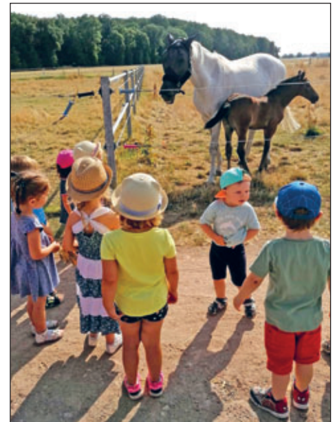
Schmetterlinge aus dem Wirbelwind besuchen die Koppel an der Lindhardt

Viele Knabbereien und eine Menge Obst stärkten uns während des Ausfluges. Müde und kaputt sind wir zurück zur Kita gelaufen.