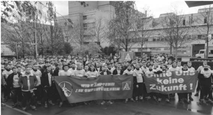
200 Azubis auf dem Weg von Brühl nach Mettingen