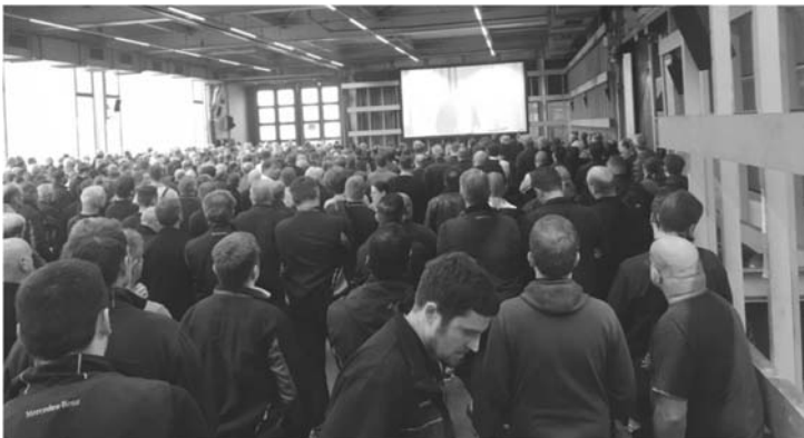
Hedelfingen: 800 in Halle 41 und 200 vor der Halle

Der GBR fordert die Unternehmensleitung auf, unverzüglich mit dem Betriebsrat Untertürkheim zu vereinbaren, den EATS am Standort UT auf Basis gültiger Tarifverträge und betrieblichen Regelungen zu entwickeln, zu montieren sowie Teile des EATS dort zu fertigen.