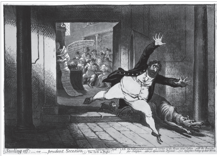
Abbildung 1: James Gillray, Stealing off; – or – prudent Seces[s]ion (London, 6.11.1798)

Die Aktion erregte im Parlament selbst und weit darüber hinaus Aufsehen. Obwohl es im eigenen Lager durchaus einige Unterstützer gab 45 , waren die Reaktionen im Ganzen diesmal doch überwiegend negativ. Wie sich insbesondere auch an den zahlreichen Karikaturen, die sich mit der Thematik befassten, zeigen lässt, kreiste die öffentliche Auseinandersetzung mit dem Boykott dabei um drei Motive, welche die breit geteilte Ansicht, dass das Handeln der Opposition eine »unwarrantable dereliction of their public duty« 46 darstelle, jeweils in ein unterschiedliches Licht rückten. Erstens wurde der Rückzug als Ausdruck politischer Feigheit gedeutet. Kurz nach dem Austritt stellte der populäre Karikaturist James Gillray die Whigs als Ratten dar, die dem Parlament, das sie versucht hatten, zu unterminieren, nun Hals über Kopf entflohen. 47 Ein Jahr später zeichnete er Fox noch einmal auf der Flucht (Abbildung 1), begleitet von seinem treuen »opposition greyhound« Charles Grey und Michael Angelo Taylor als fipsigem Schoßhündchen. Im Hintergrund waren diesmal jedoch auch die inzwischen in die Kammer zurückgekehrten Oppositionsabgeordneten zu sehen, die in einem »democratic Déjeuné« gezwungen werden, demütig ihre großen Worte beim Austritt zu verspeisen, während Premierminister William Pitt der Jüngere ihnen eine lange Liste seiner politischen Erfolge vorhält. 48