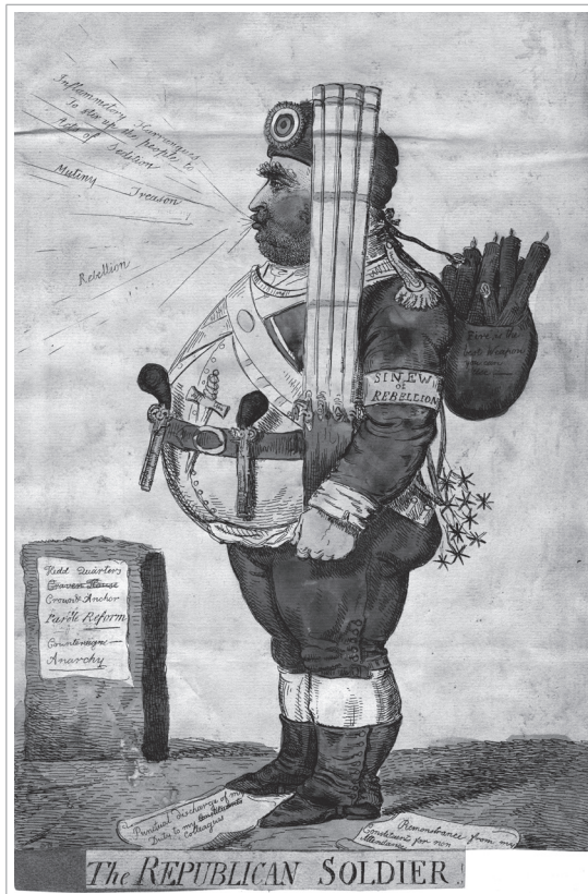
Abbildung 4: Isaac Cruikshank, The Republican Soldier! (London, 12.5.1798)

Auch da eine einheitliche Rechtfertigungsstrategie vonseiten der Whigs ausblieb, dominierten die negativen Darstellungen die öffentliche Wahrnehmung des Boykotts. Hinzu kam, dass auch seine praktische Umsetzung erneut zu wünschen übrig ließ. Die Whigs waren keine Partei im späteren Sinne, sondern ein lose organisiertes Netzwerk von gleich gesinnten Abgeordneten, die sich bei wichtigen Abstimmungen tendenziell, aber keineswegs immer, an der Linie ihres informellen Anführers Fox orientierten. Darüber hinaus blieb die Boykottstrategie selbst in Fox' unmittelbarem Umfeld umstritten. 55 Verschiedene führende Abgeordnete waren der Meinung, dass die Abkehr vom Parlament einen allzu radikalen Bruch mit dem politischen System impliziere. »Secession means rebellion«, meinte etwa John Petty, der 2. Marquis von Lansdowne, »or it is nonsense«. 56 Andere, wie George Tierney, hielten den Rücktritt für unvereinbar mit ihrem Wählermandat.