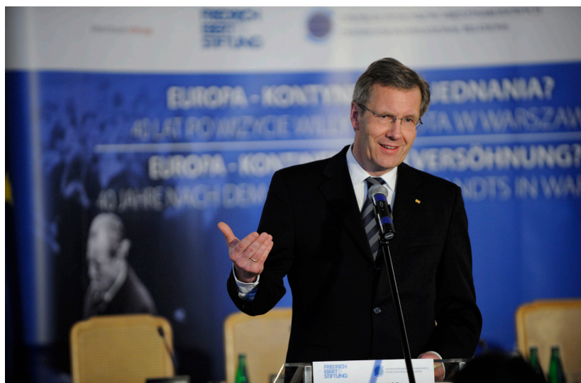
Bundespräsident Christian Wulff unterstreicht die Bedeutung von Brandts Kniefall: Er übernahm Verantwortung für die Vergangenheit, die Gegenwart und die Zukunft.