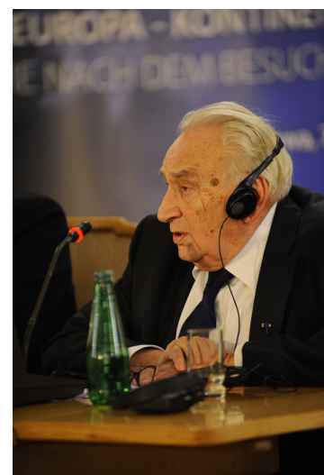
Egon Bahr, Bundesminister a.D. und Berater des Bundeskanzlers Willy Brandt schildert die Ereignisse des 7. Dezember 1970 aus seiner Perspektive.