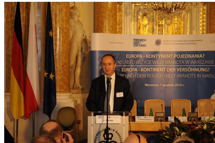
Janusz Reiter, Präsident des Zentrums für Internationale Beziehungen und Botschafter der Republik Polen a.D.

Herzlichen Dank für Ihre Aufmerksamkeit.