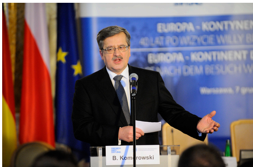
Bronisław Komorowski, Staatspräsident der Republik Polen, erläutert die Auswirkungen von Willy Brandts Polen-Besuch. Brandt „zeigte den Polen mit einem Mal, dass die Deutschen anders sind“.