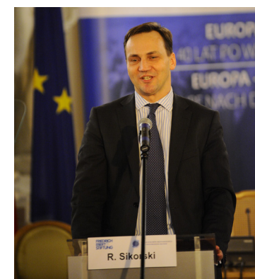
Radosław Sikorski, Außenminister der Republik Polen, spricht über die deutsch-polnischen Beziehungen im europäischen Kontext: „Auf diesem Fundament des gegenseitigen Respekts, der gemeinsamen Interessen und der Versöhnung, zu dem Willy Brandt den Grundstein legte, sollten wir unsere gemeinsame Zukunft aufbauen“.