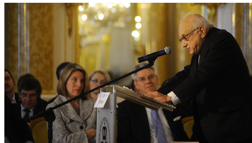
Fritz Stern, Prof. em. der Columbia University in New York, spricht über die Bedeutung von Brandts Lösung „Mehr Demokratie wagen“ in der Gegenwart: „Mehr Demokratie wagen bedeutet heute, dass man die Identität der demokratischen liberalen Toleranz, die Rechtsstaatlichkeit und die Sicherheit der Bürger schützt.“