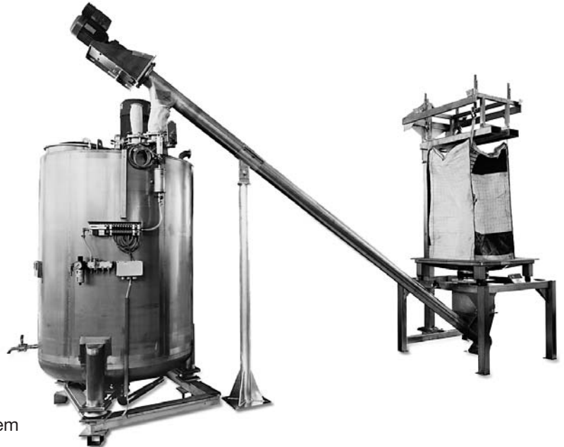
■ Big-Bag Verwiegung und Lösebehälter

Advantages constant glue quality, simple and cost efficient system