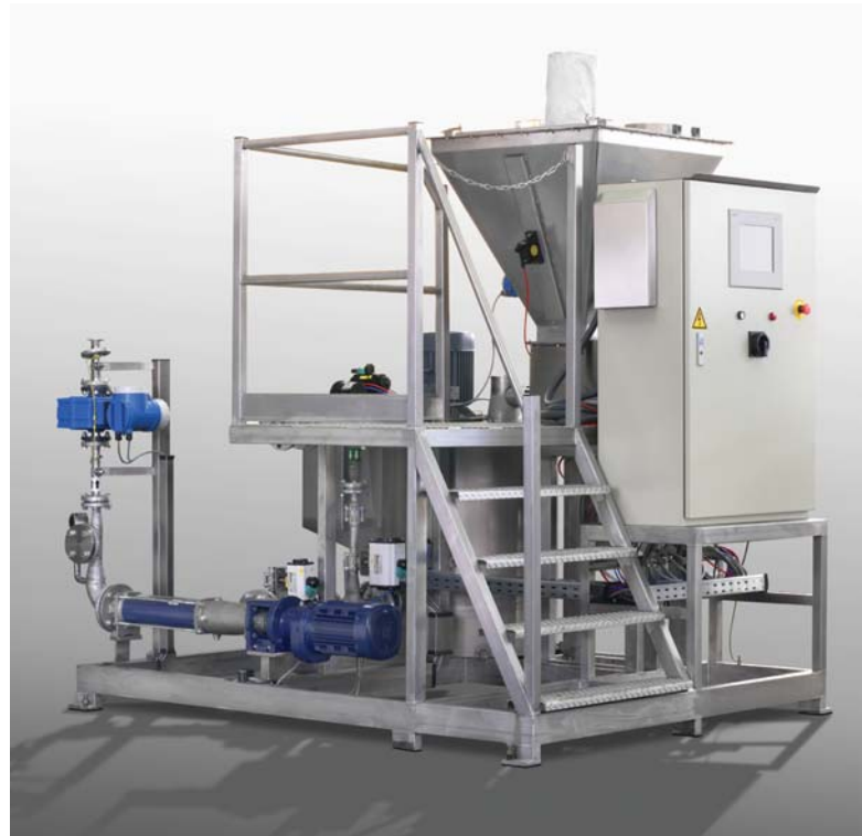
■ Dispergierstation ■ Dispersing unit

In the enzymatic process during start and stop procedure, the reaction time is constant, therefore the variation in the glue properties is reduced to a minimum