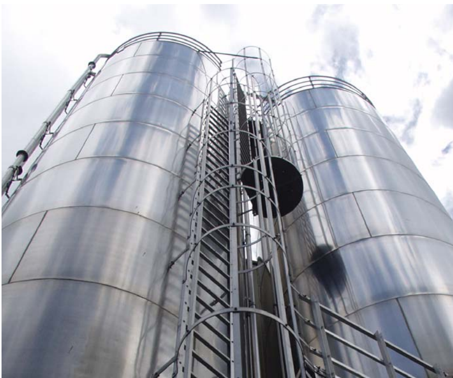
■ Siloanlage 200 m 3

■ Storage of powders and granulates in Silos up to 200m 3 Big-Bag discharge systems Volumetric and gravimetric metreing systems for solids