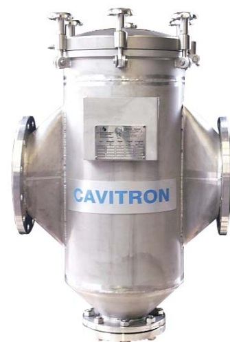
■ Magnetabscheider ■ magnetic separator