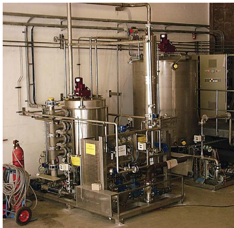
■ enzymatische Stärkeaufbereitung ■ enzymatic starch degradation