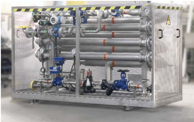
■ Stärkekocher Durchsatz 1000 - 6000 l/h ■ Starch cooking unit Capacity 1000 - 6000 l/h

■ Starch glue preparation for surface sizing, continuous operation, thermochemical / enzymatic