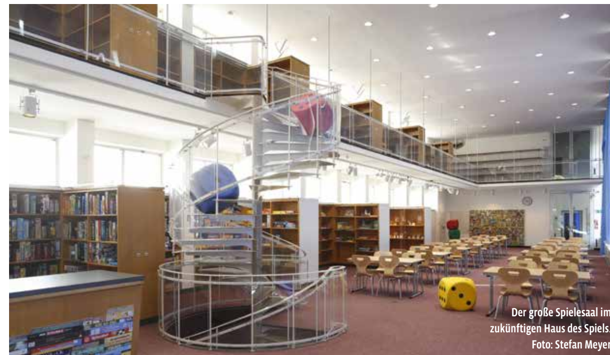
Der große Spieleaal im zukünftigen Haus des Spiels.