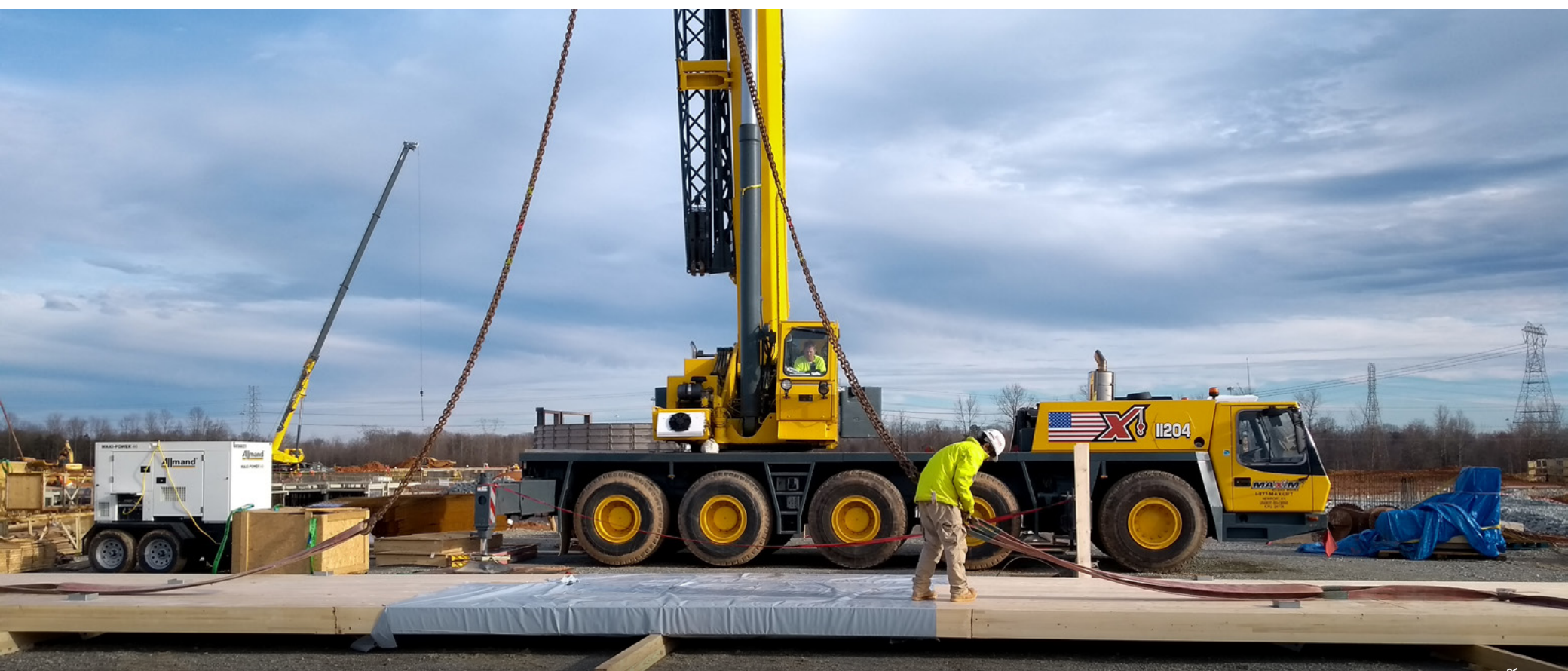
Einer von insgesamt 61 Stößen: Ein zusammengefügter HESS LIMITLESS-Träger ist im Stoßbereich abgeklebt und bereit zur Montage in den dafür vorgesehenen Stahlbetonstützen. Der HESS LIMITLESS-Träger wird auf der Baustelle der Firma EGGER in Lexington (USA) gerade mit einem Kran hantiert.

Die erste allgemeine bauaufsichtliche Zulassung (abZ) von HESS LIMITLESS erschien 2010. Durch die Eingliederung von HESS TIMBER in die HASSLACHER Gruppe rückte auch die Forschungs- & Entwicklungsarbeit wieder stärker in den Fokus. Zur Jahresmitte 2019 erscheint daher nun eine erweiterte und optimierte Zulassung, auf deren Basis künftig noch wirtschaftlichere Lösungen angeboten werden können. Zudem hat sich das Portfolio an unterschiedlichen Festigkeitsklassen deutlich erhöht. Das bedeutet, dass für das jeweilige Bauvorhaben genau jene Festigkeitsklasse gewählt werden kann, welche die wirtschaftlichste Lösung bietet. Parallel dazu wird bereits an einer Europäischen Technischen Bewertung gearbeitet, die im Jahre 2020, so der Plan, erscheinen soll.