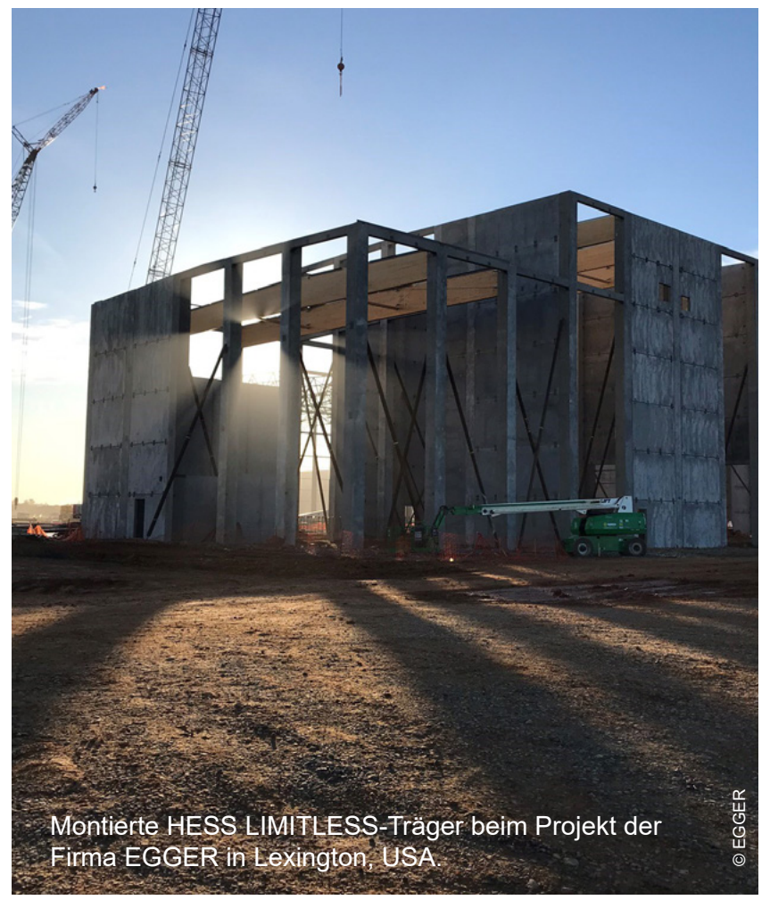
Montierte HESS LIMITLESS-Träger beim Projekt der Firma EGGER in Lexington, USA

Bei HESS LIMITLESS handelt es sich um eine patentierte und zugelassene Komplettlösung zur Herstellung von theoretisch endlos langen stabförmigen Bauteilen. Dabei werden Brettschichtholzträger werkseitig segmentiert und speziell vorgefertigt. Der Vorteil ist, dass durch diese Segmentierung ein flexibler (Entfall von zeitaufwändigen Genehmigungen), sicherer (Containertransport) und kostengünstiger Transport (auch an schwer zugänglichen Stellen) in herkömmlichen Standardcontainern ermöglicht wird. Gerade bei Überseeprojekten oder beispielsweise bei engen Baustellenzufahrten verschafft die Segmentierung oftmals den entscheidenden Vorteil. Zudem ist die reine Holz-Holz-Verbindung herkömmlichen Verbindungstechnologien im Hinblick auf Leistungsfähigkeit – der sogenannte Patentstoß weist einen Wirkungsgrad von 100% auf – überlegen, insbesondere bei weitgespannten Dachtragwerken. Da kein Projekt dem anderen gleicht, planen die HESS TIMBER Ingenieure HESS LIMITLESS maßgeschneidert auf die Anforderung des jeweiligen Bauvorhabens.