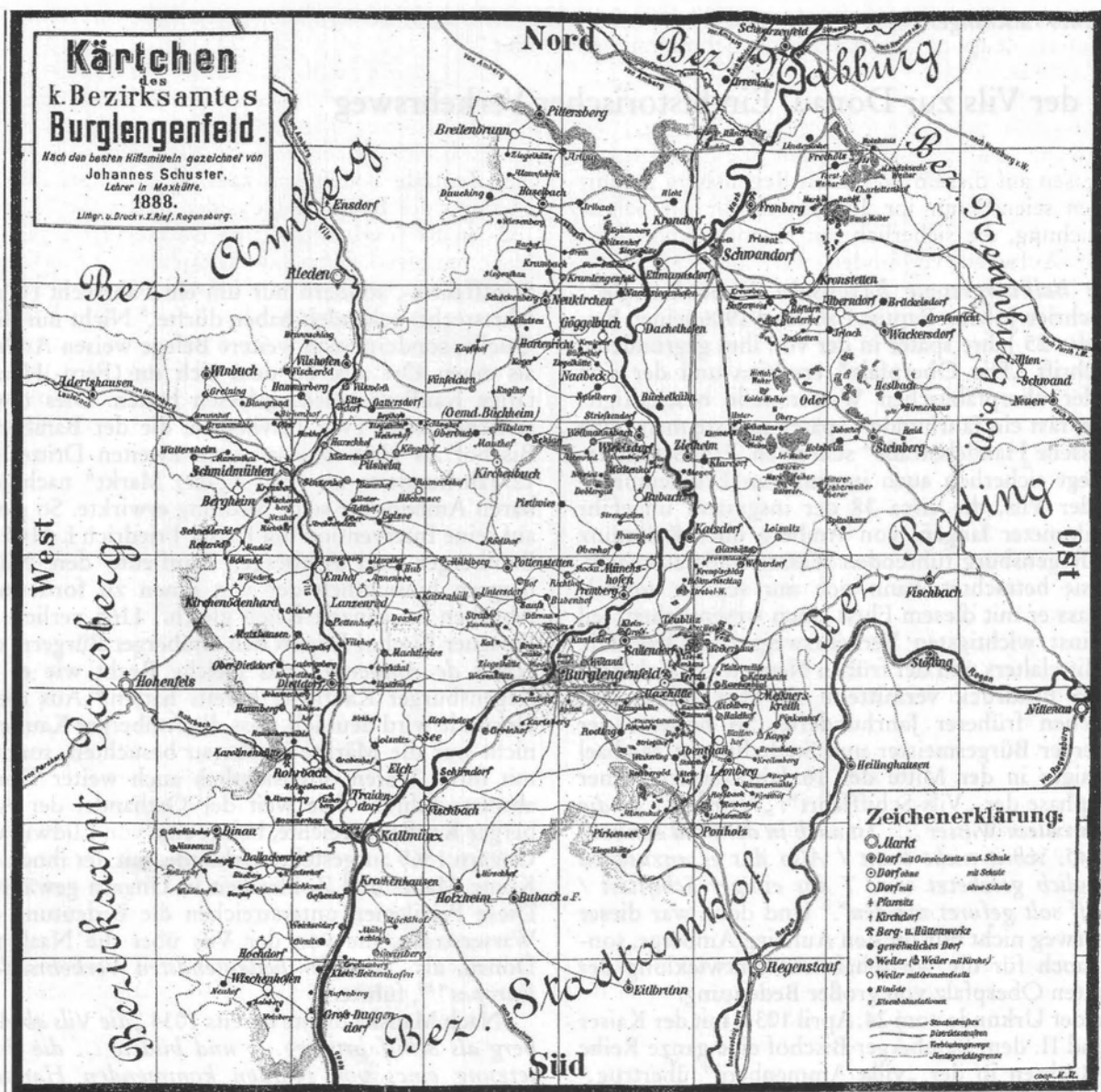
Karte des kgl. Bezirksamtes Burglengenfeld 1888, links die Vils von Ens Dorf bis Kallmünz (aus: Johannes Schuster: Beschreibung des kgl. Bezirksamtes Burglengenfeld. Regensburg 1888)